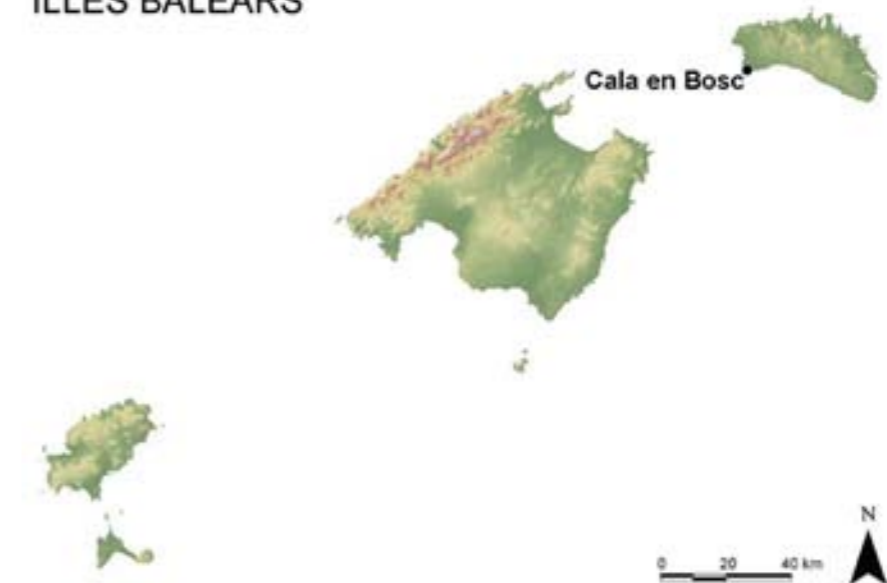
Figura 1. Localització de cala en Bosc a Menorca.