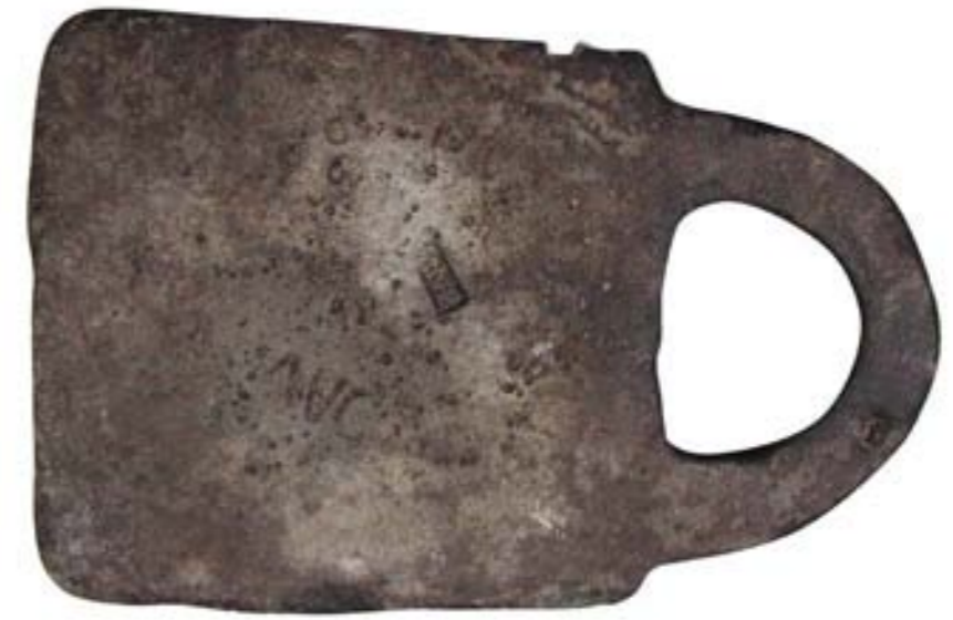
Figura 3. Fotografia de l'anvers del lingot actualment dipositat en el Museu Municipal de Ciutadella (autors: Mateu Riera, amb retocs de Joan C. de Nicolás).