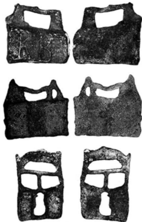
Figura 8. Lingots d'estany del derelictes Port Vendres II, de 10,48, 6,45 i 3,27 quilògrams (Colls et al. 1977).

Portvendres, de l'època de Claudi. L'enfonsament del derelictes esmentat s'ha proposat de mitjans del segle I dC, atesa la càrrega, d'entre la qual destaquen les àmfores vineres i olieres de la Bètica, i altres lingots de plom i de coure que feien costat als d'estany (figura 8), un estany del qual s'ha proposat que seria originari de les Illes Britàniques o de la península Ibèrica (Colls et al. 1977; Rico 2011; Rico, Domergue 2016).