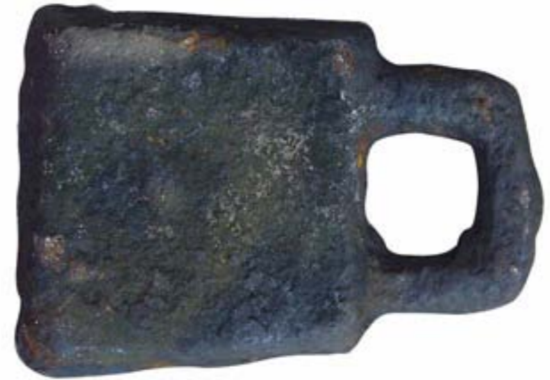
Figura 7. Fotografia del revers d'un dels lingots perduts (autors: Marcelino Llaveró, amb retocs de Joan C. de Nicolás).