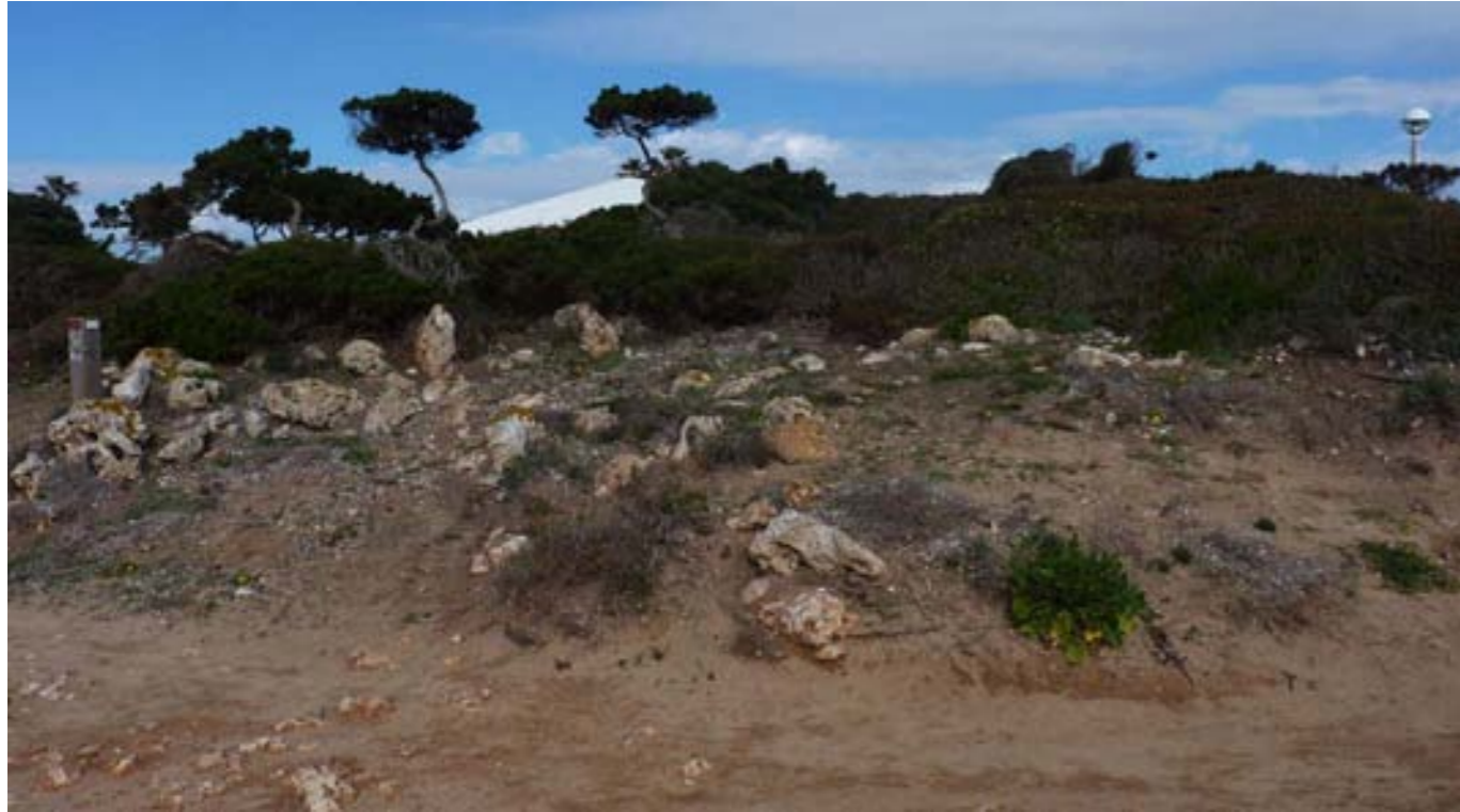
Figura 10. Estructures de l'estació arqueològica SXO-05 (autor: Andreu Torres Bagur).