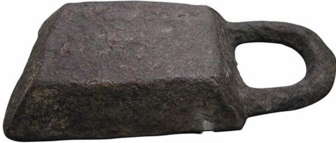
Figura 5. Fotografia del lateral del lingot actualment dipositat en el Museu Municipal de Ciutadella.

Pel que fa a la composició, se'n va fer una anàlisi als Serveis Científicotècnics de la Universitat de les Illes Balears, amb l'assessorament del tècnic Ferran Hierro. L'aparell utilitzat va ser un microscopi electrònic de rastreig (SEM), de la marca «Hitachi S-530», que té acoblat un sistema de microanàlisi R-X-EDS «link ISIS» i un sistema digital d'adquisició d'imatges. És per això que es va extreure una petita mostra de la peça per posar-la a l'interior de l'aparell. Aquest sistema presenta un grau de viabilitat alt, però només a la zona en la qual incideixen els electrons, més o menys uns 3-5 mil·límetres quadrats i 2-3 cm de profunditat (microvolum afectat). Per això, era necessari fer diversos sondejos que, en aquest cas, varen ser tres. Així, el marge d'error és d'1 % sobre la realitat i el resultat va ser, sense cap mena de dubte, que s'estava al davant d'un lingot amb gairebé un 100 % d'estany.