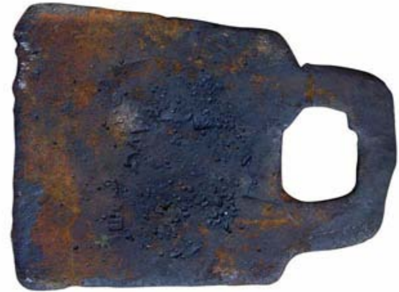
Figura 6. Fotografia de l'anvers d'un dels lingots perduts.