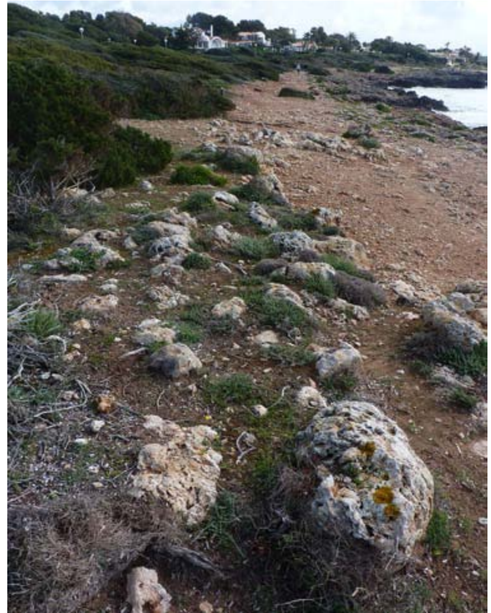
Figura 11. Detall de les estructures de l'estació arqueològica SXO-05 (autor: Andreu Torres Bagur).