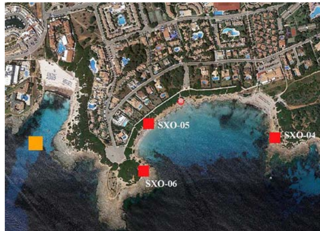
Figura 9. Vista aèria de la zona de cala en Bosc i de la badia de Son Xoriguer. El quadre groc marca, aproximadament, el lloc on es varen trobar els tres lingots, mentre que els quadres vermells assenyalen els petits jaciments arqueològics (autor: Joan C. de Nicolás, a partir del Google Maps).

del camí de Cavalls. N'hi ha tres que es troben entorn a la badia de Son Xoriguer (figura 9). En el que sembla que s'ha conservat millor (SXO-05 de la figura 9) es poden apreciar alguns fonaments d'estructures arquitectòniques preromanes aparentment, ateses les escasses restes ceràmiques superficials que es poden apreciar per la contrada. Tanmateix, és evident que, amb les dades actuals, és impossible saber quina va poder ser la destinació prevista dels lingots aquí presentats.