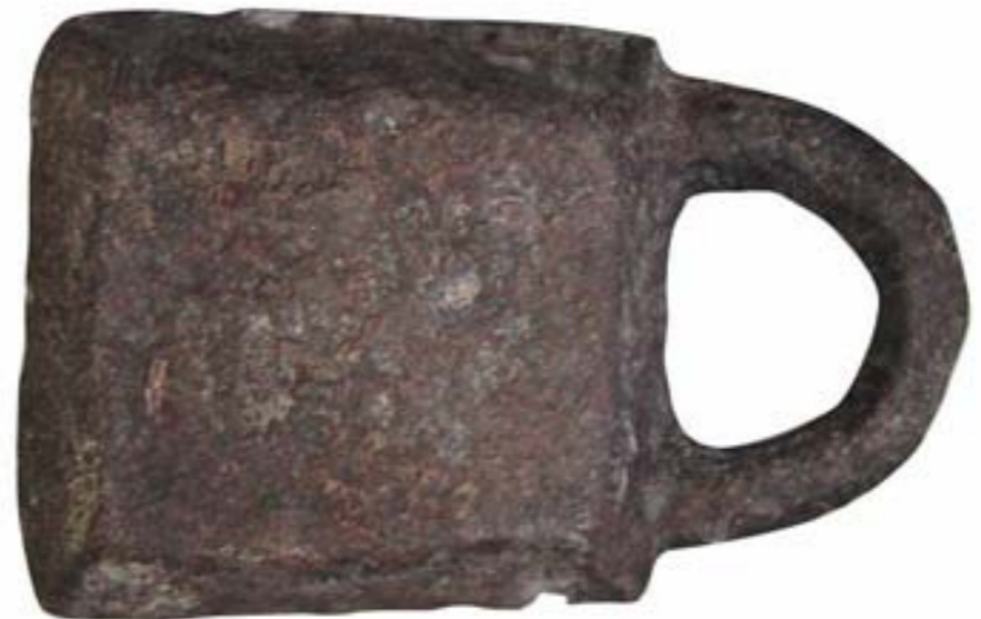
Figura 4. Fotografia del revers del lingot actualment dipositat en el Museu Municipal de Ciutadella (autors: Mateu Riera, amb retocs de Joan C. de Nicolás).