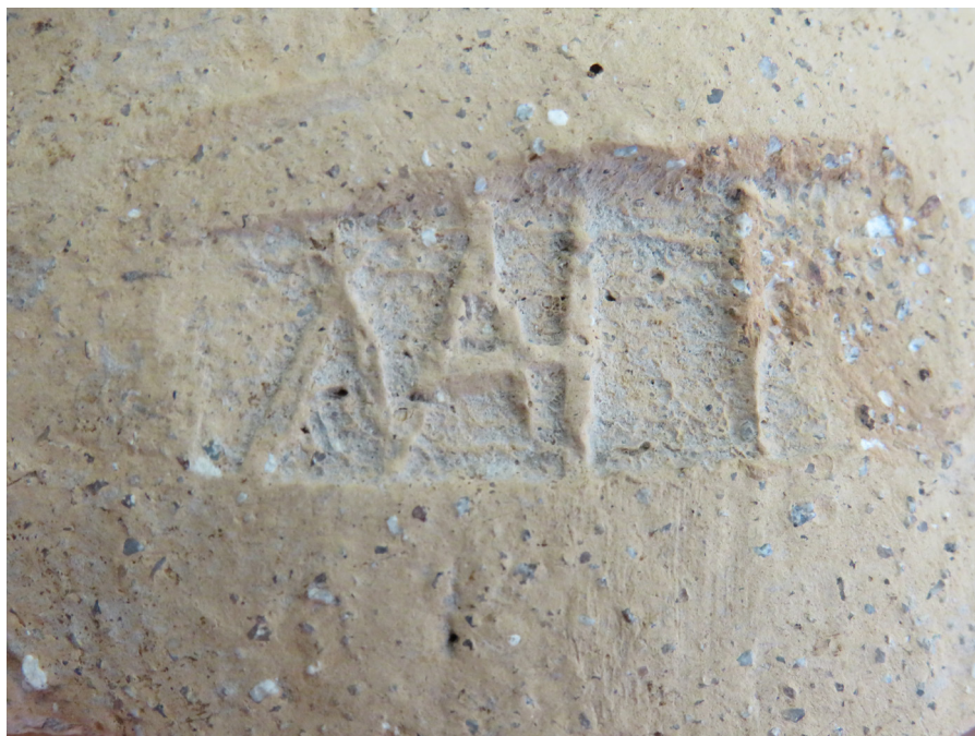
Figura 2. Detalle marca

El cognomen Mabes está bastante extendido en sigilla sobre opus figlinae , especialmente sobre Terra Sigillata