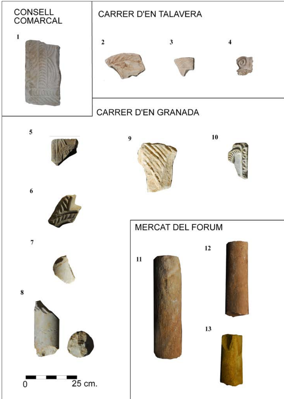
Figura 2. Peces del catàleg: 1. Consell Comarcal del Tarragonès - antic hospital de Santa Tecla; 2-4. carrer d'en Talavera; 5-10. carrer d'en Granada; 11-13. antic mercat de el Fòrum.