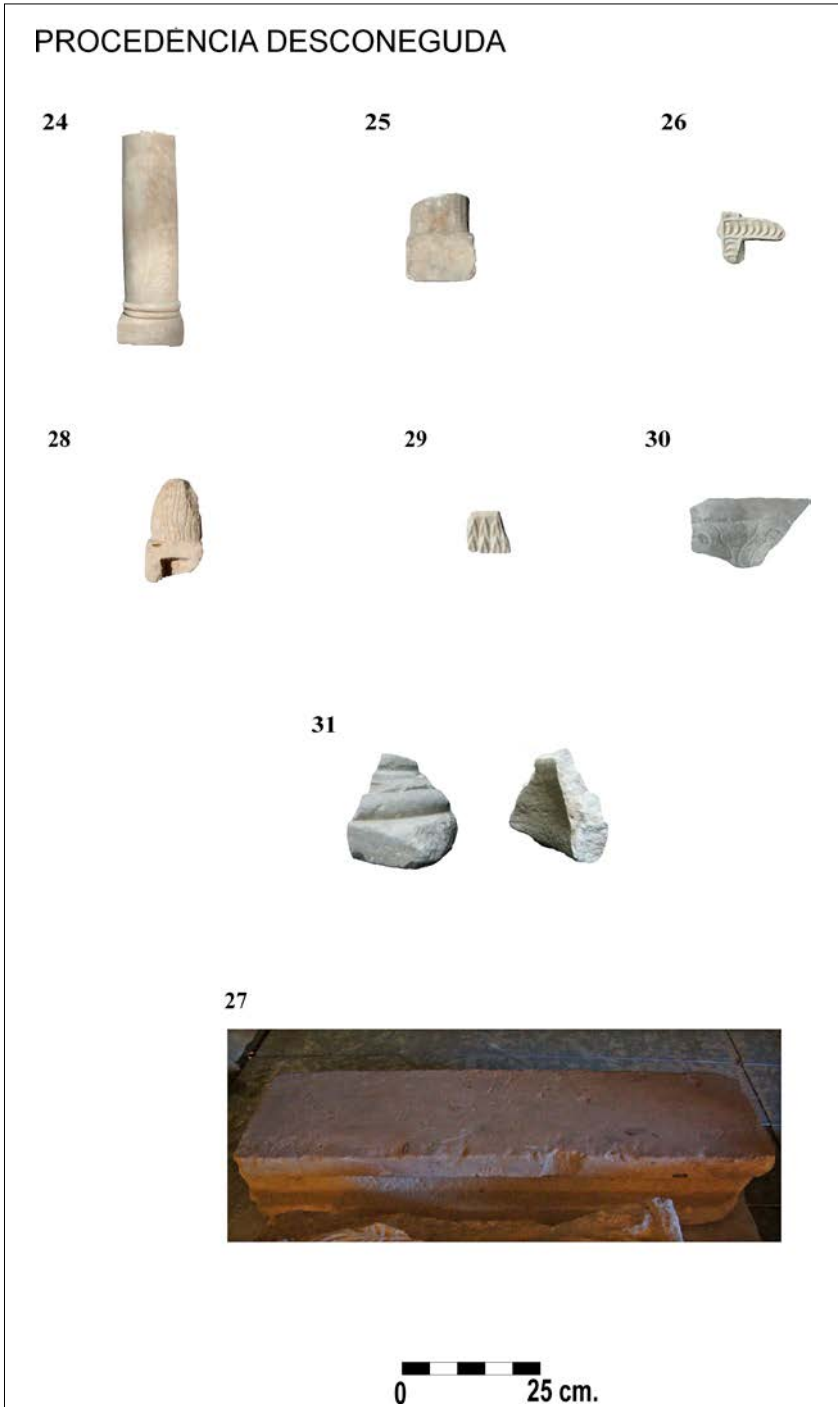
Figura 5. Peces del catàleg: 26-33 procedència desconeguda.