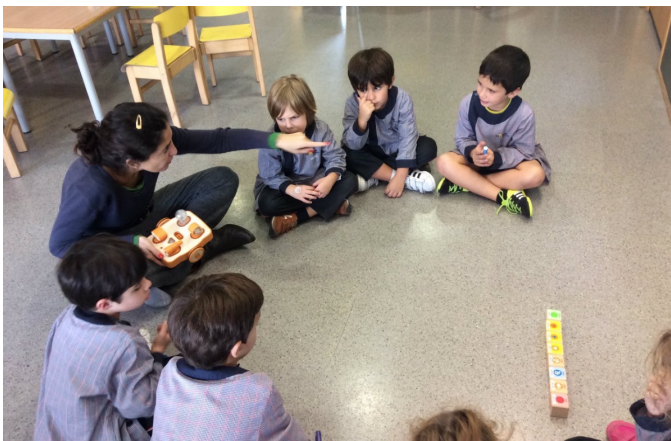
Figura 2: Sesión de robótica con KIBO en una de las escuelas del estudio

Tres de cada cuatro maestros diseñaron una sesión extra final con el robot. La sesión que diseñaron no solo incluyó tecnología, sino que ésta fue integrada en los contenidos de aprendizaje. Las sesiones diseñadas, sin embargo, fueron eficientes pero no disruptivas; la capacitación fue más bien una herramienta para empoderar a maestros, para familiarizarlos con prácticas de la enseñanza de la robótica reconocidas en la literatura científica, y para aumentar la confianza en la integración de la robótica en su práctica diaria.