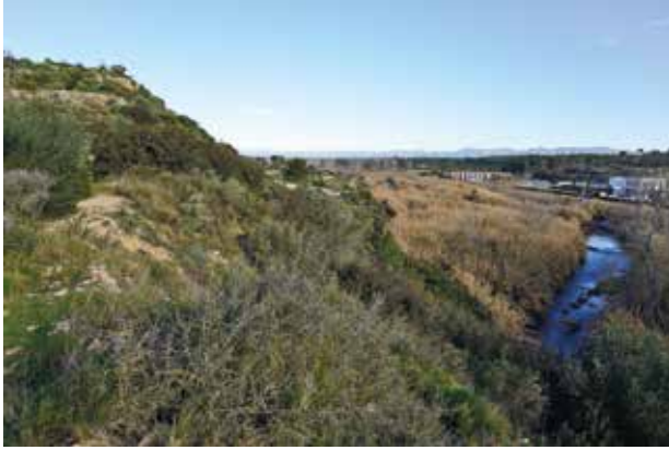
Vista del río Túria a su paso por València la Vella. Se aprecian los muros de la acrópolis en la zona alta.

Pese a ello, València la Vella constituye un reto científico y de socialización relevante del patrimonio histórico.