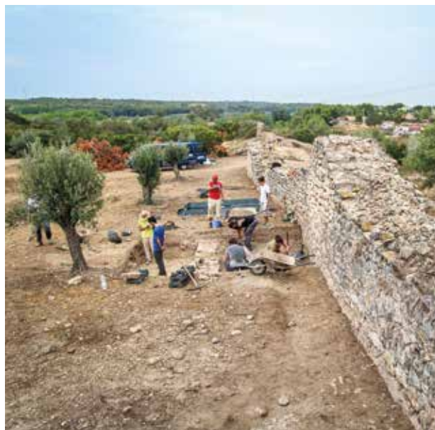
Inicio de la excavación del sector junto a la muralla. Campaña 2016.

El resto del asentamiento consta de dos plataformas intermedias donde los sondeos estratigráficos han localizado varios restos. Por una parte, una zona intermedia-baja que limita con la muralla central y meridional. Aquí se alcanza una extensión de 0,77 ha y una altitud entre los 85 y 88 m. Es el lugar mejor conocido y donde se ha trabajado intensamente en el lado de la muralla. La plataforma inferior alcanza unas 1,27 ha y entre los 80 y 84 m de altitud. Todo parece indicar que en su parte occidental se encuentra el centro principal del asentamiento. Aquí excavaron hace 40 años Gerardo Pereira y Carmen Aranegui, de la Universitat de València, y encontraron dos