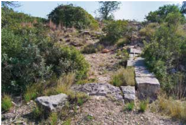
Vista actual de la zona monumental envaïda per la vegetació.

recuperades, procedeixen de seques de nombrosos indrets d'Hispania i de la Mediterrània que ens assenyalen la vitalitat econòmica i comercial del lloc.