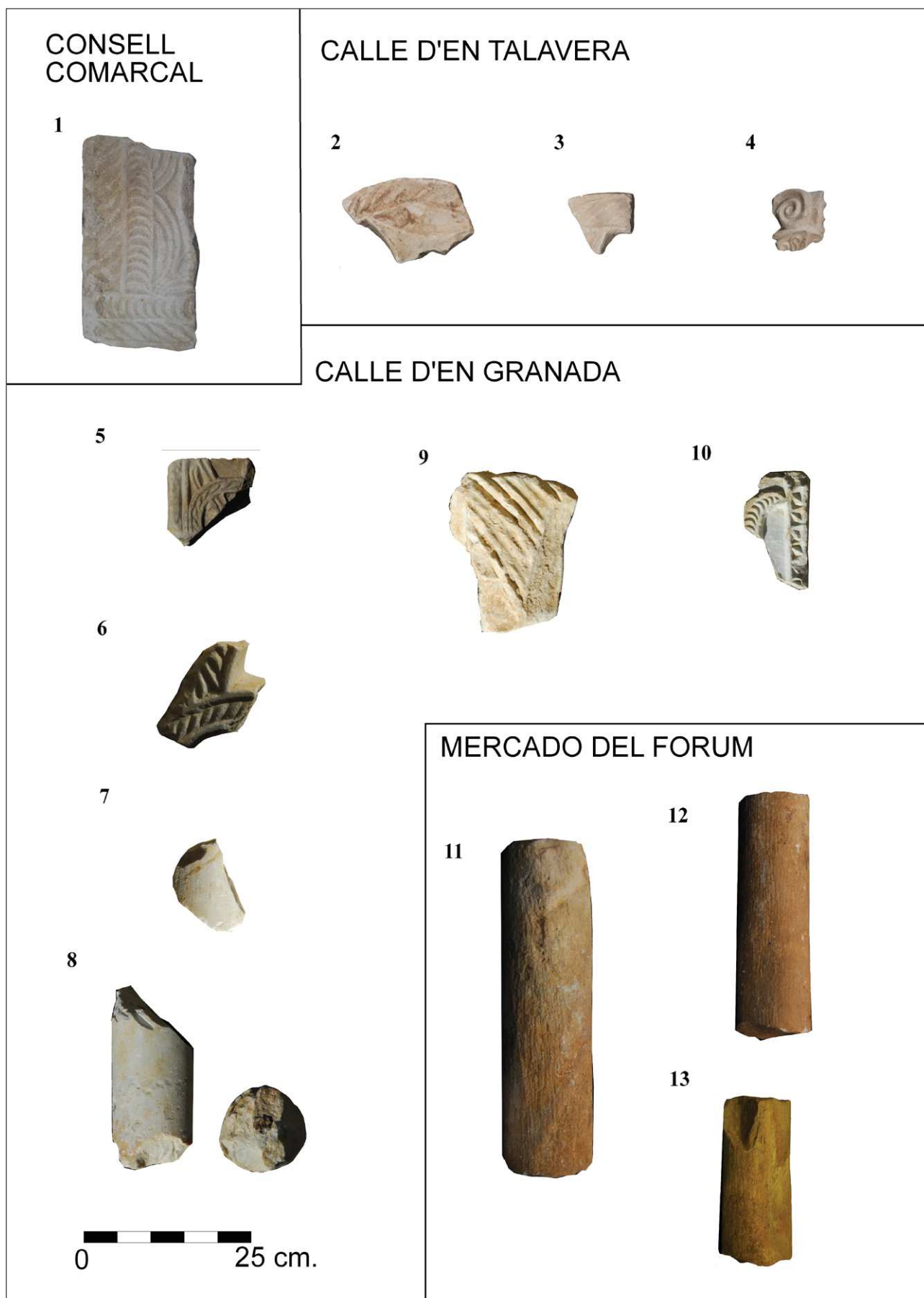
Figura 2. Piezas del catálogo: 1. Consell Comarcal del Tarragonès - Antiguo hospital de Santa Tecla; 2-4. Calle d'en Talavera; 5-10. Calle d'en Granada; 11-13. Antiguo mercado del Forum.