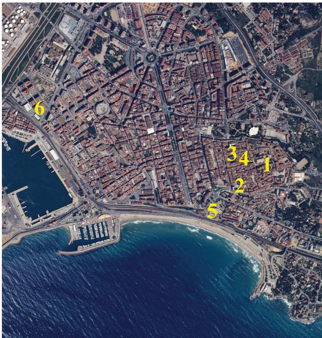
Figura 1. Situación de la procedencia de las piezas:

nes y stocks de material vinculados a la construcción del Concilio Provincial (s. I), aunque algunas piezas utilizan la biocalcarenita local del tipo Mèdol. En cuanto a la cronología, en principio se trata de piezas datables en su mayoría en los s. VI-VII. Hay dos ejemplares –calle d'en Comte 11, 11b y plaza de Dames i Vells– que por sus paralelos pueden abrir las puertas a dataciones de s. VIII-X.