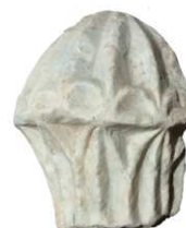
Figura 3. Piezas del catálogo: 14-15. Calle d'en Comte 3-5-7; 16-17. Calle d'en Comte 11; 18. Plaza de Dames i Vells; 19. Anfiteatro.