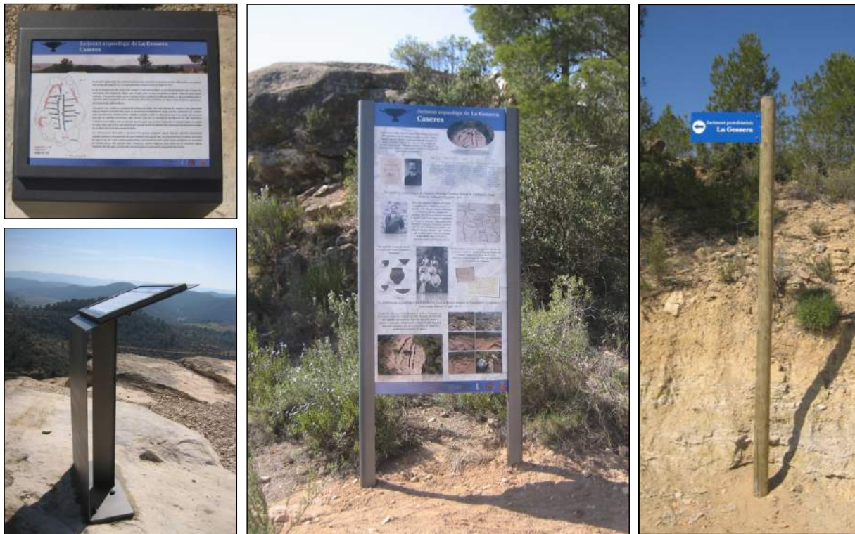
Figura 7. Cartells de la Gessera. A l'esquerra, faristol d'explicació del jaciment; al mig, plafó amb explicació de la història de les intervencions a la Gessera; a la dreta, cartell de senyalització del camí

bilitat d'algunes de les estructures i evitar-ne nous despreniments, es va construir una petita base de morter de calç, utilitzant la tècnica de l'encofrat amb taulons de fusta, intentant imitar la mateixa roca calcària i creant bases més estables i sòlides en aquells punts on es va considerar oportú.