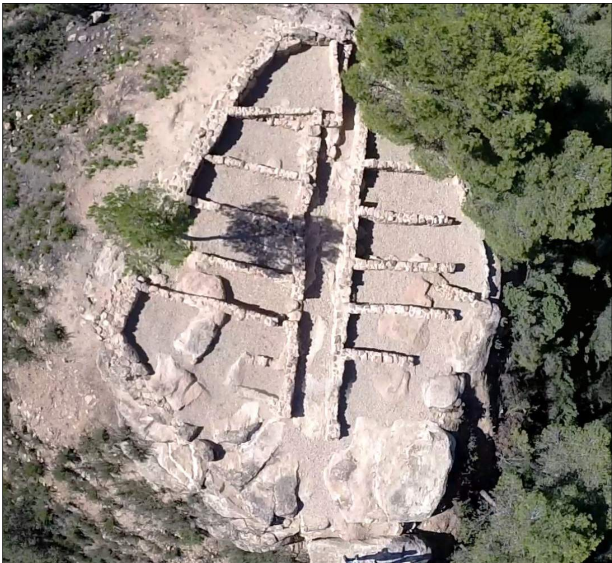
Figura 8. Vista aèria de la Gessera un cop finalitzats els treballs arqueològics i d'adequació

fet que no es tractés d'un poblat, com ja s'ha apuntat. En tercer lloc, cal destacar l'alta proporció de vernissos negres dipositats al MAC relatiu a les excavacions de 1914, en relació amb la quantitat total de material recuperada. En últim lloc, i com un complement dels treballs realitzats pel nostre equip al jaciment de la Gessera, es va elaborar un estudi arqueoastronòmic d'orientació que ens ha proporcionat uns resultats força interessants que, d'altra banda, acabarien de reforçar aquesta hipòtesi de la Gessera com a edifici de culte. Segons aquest estudi, els dies equinoccials, mentre l'edifici va funcionar, la llum solar penetrava per l'accés oriental del recinte, avançant per tot