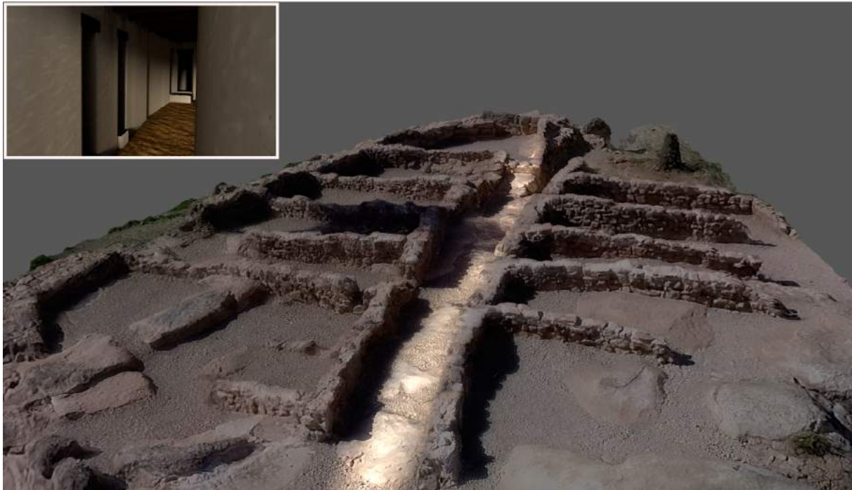
Figura 9. Simulació de l'entrada de llum a l'edifici de la Gessera, durant els equinoccis, fins arribar i il·luminar el recinte A11

el passadís central mentre el sol s'elevava, fins anar a morir al fons de l'habitació A11 (Pérez [et al.] 2015), just a la cantonada que ressalta en aquest àmbit perquè trenca l'ordre de circulació pel passadís central. Cal afegir que es tracta d'un recinte aparentment creat ad hoc, ja que no encaixa amb la resta de l'urbanisme ni pel que fa a dimensions ni a posicionament i que, si es tractava d'un espai cultural, podria haver tingut la funció de cel·la.