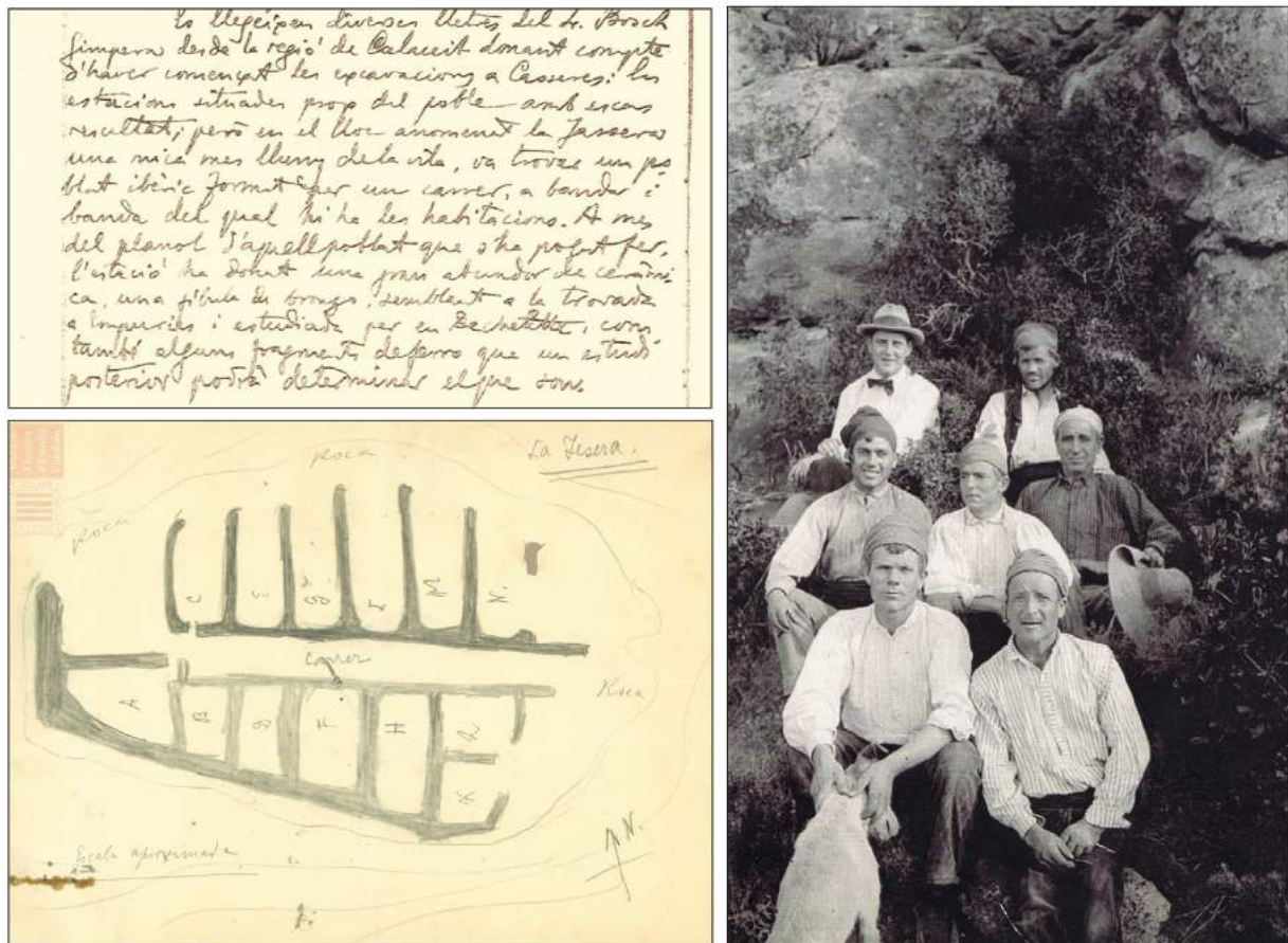
Figura 2. Esquerra superior: fragment de l'acta del 14.10.1914 de l'Institut d'Estudis Catalans; esquerra inferior: plànol de la Gessera de Pere Bosch Gimpera. Dreta: fotografia de P. Bosch Gimpera i els treballadors que van col·laborar en l'excavació de la Gessera

fibula de bronze semblant a la trobada a Empúries i estudiada per Dechelette, com també alguns fragments de ferro, que un estudi posterior podrà determinar el que són” (Arxiu de l'IEC, acta del 14.10.1914).