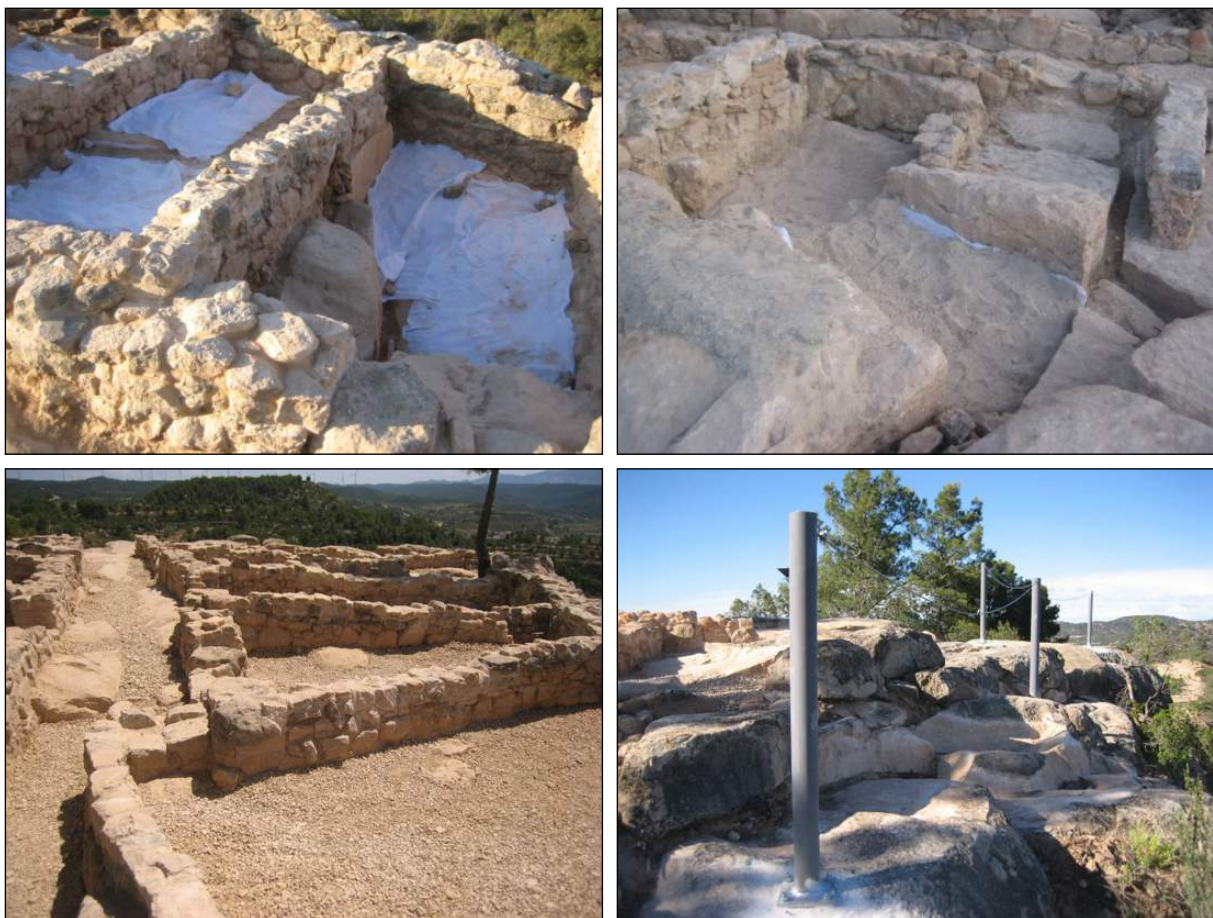
Figura 6. Vista del procés de museïtzació. Cobriment del terreny natural amb geotèxtil, després amb sorra i acabat amb grava. Detall de la protecció metàl·lica

aspecte molt semblant al que devia tenir originalment. També es va optar, tant en el tram sud com en el llenç oest de la muralla, per tal d'assegurar i garantir l'estabilitat de l'estructura i evitar futurs despreniments, per injectar morter de calç en tots aquells punts que presentaven esquerdes profundes. L'únic tram de parament que es va restituir de nou sense tenir evidències arqueològiques va ser un petit llenç de poc més de 2 m de longitud corresponent al flanc septentrional de la muralla; aquesta decisió va estar motivada per tal de facilitar les posteriors tasques de museïtzació d'aquest sector del jaciment, partint tant de l'orientació com de l'amplada de la mateixa muralla. Al sector est de l'assentament, la zona més malmesa i erosionada, es va decidir no restituir cap dels murs davant la total absència d'aquests. Fins i tot, en alguns casos, per garantir l'esta-