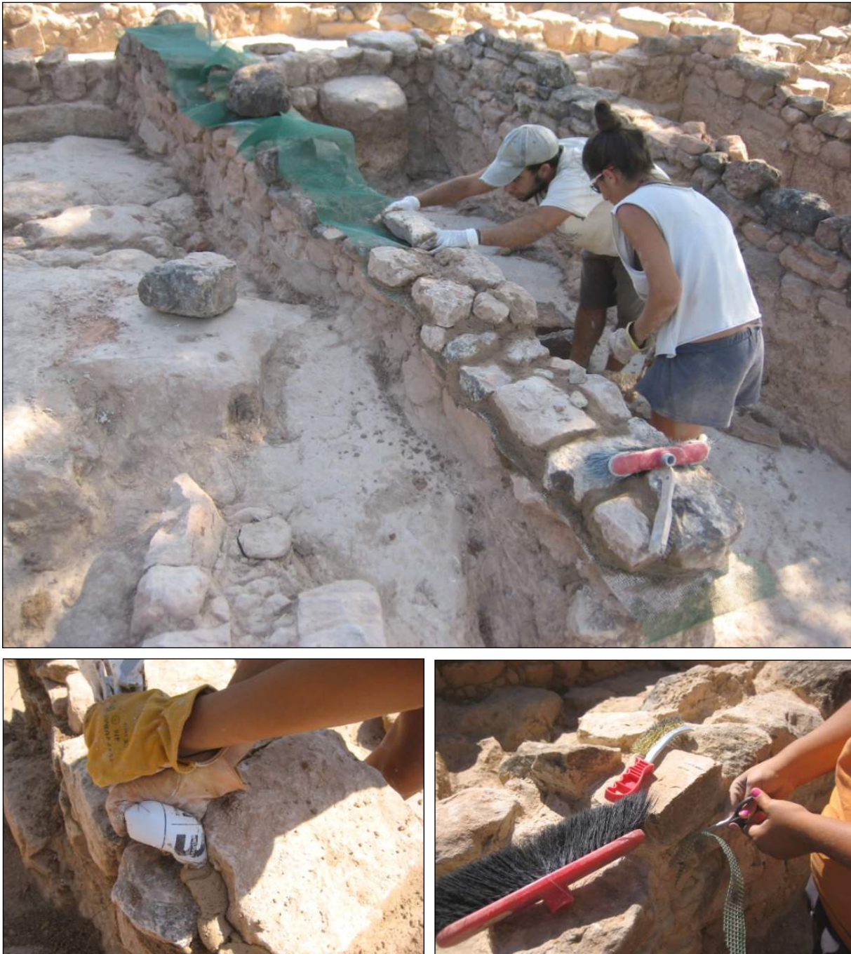
Figura 5. Detall dels treballs de consolidació de les estructures conservades

la seva intervenció i que estava dipositat al Museu Arqueològic de Catalunya. Es van identificar alguns d'aquests accessos, fet que en va possibilitar la restitució. En els casos en què el material fotogràfic antic i la planimetria no eren prou clars o generaven dubtes, es va optar per restituir el mur de manera contínua, però a una cota més baixa, per evitar possi-