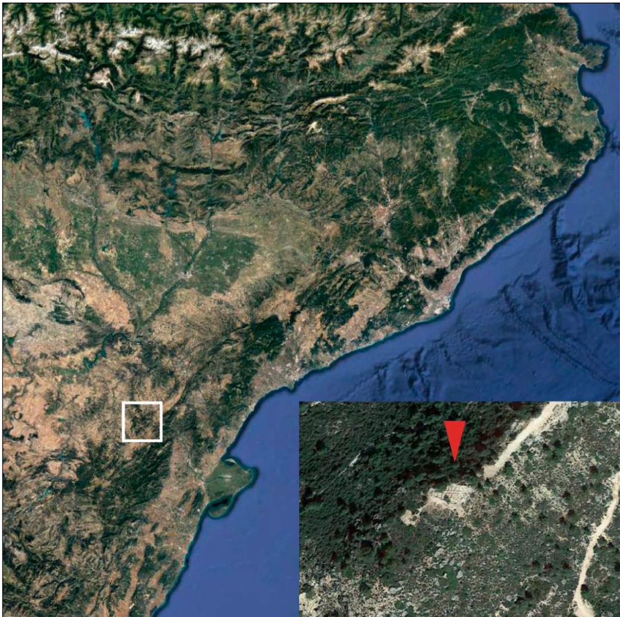
Figura 1. Situació de la Gessera de Caseres (Terra Alta)

diferents graus de resistència, amb cornises més o menys abruptes, amb capes de pedres calcàries sorrenques i gresos calcaris miocènics molt sòlids, mentre que les vessants tenen capes de margues menys compactes; en aquest sentit, a causa d'un procés continuat de fissuració i descomposició que provoca la separació i caiguda de grans blocs de pedra d'aquestes cornises, s'han generat també una sèrie de petites plataformes intermèdies, tan característiques d'aquesta regió. Aquest