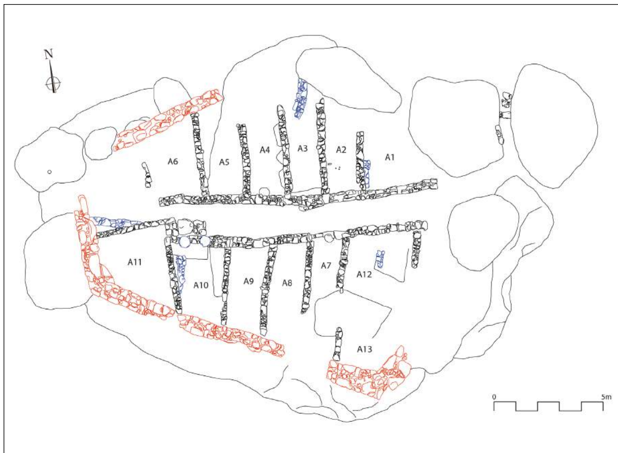
Figura 4. Plànol actualitzat de la Gessera. En roig, mur perimetral corresponent a les dues fases d'ocupació; en blau, estructures de la primera fase d'ocupació; en negre, estructures de la segona fase d'ocupació

Aquest urbanisme tan ben definit només es veu alterat o modificat en dues zones molt concretes. La primera excepció a aquesta distribució urbanística la trobem a l'àmbit A13, que, tot i no estar clars els seus límits per la manca de conservació d'una part dels murs que el delimitarien, s'emmarcaria entre el mur perimetral (al sud) i l'àmbit A12 (al nord), de manera que no tindria, almenys aparentment, un accés directe al carrer central. La segona excepció o