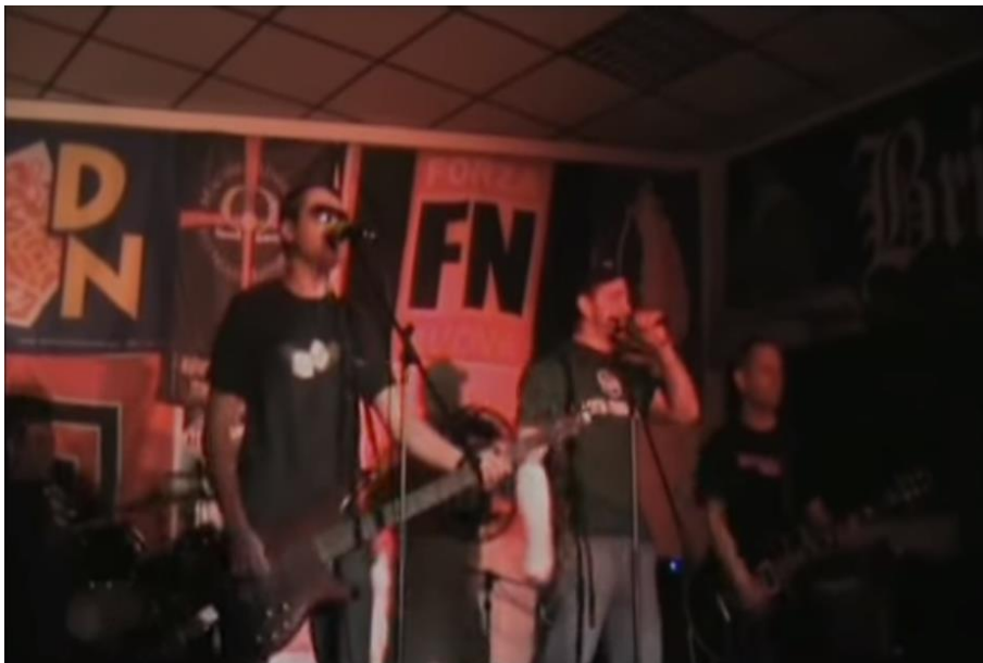
Imatge - 8 Concert de Brigada 1238 organitzat pel Presidi Milano, on s'hi observen banderes de DN, FN, Forza Nuova, i l'NPD, (YouTube: nissah).