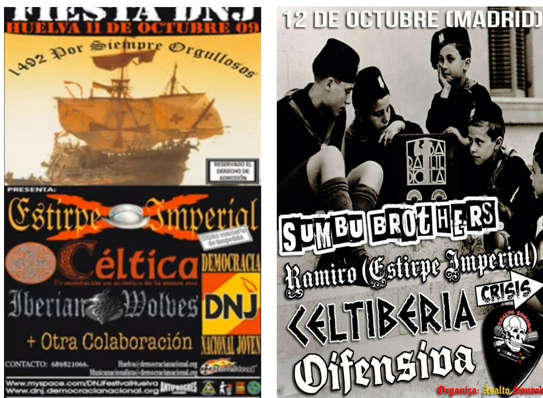
Imatge - 6 Cartell del concert de DNJ a Huelva el 2009, DNJvideos (Youtube) ; Cartell del concert del dia de la Hispanitat a Madrid organitzat per Asalto Sonoro, DiagonalPeriódico, 2013.

He pogut constatar que és difícil saber quan i a on hi ha un concert de RAC si no formes part del cercle que l'organitza. Sí que hi ha cartells pujats a les xarxes, segurament posteriors al concert (vegeu Imatge 6).