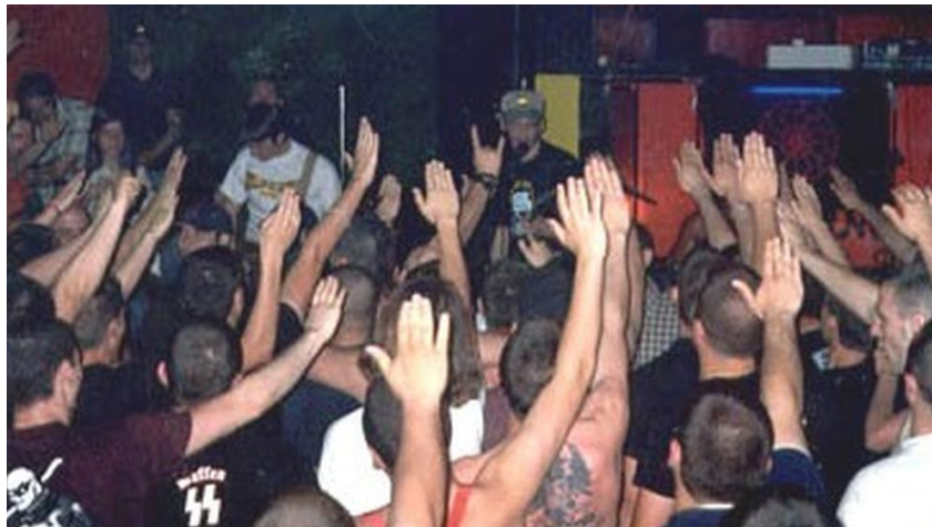
Imatge - 7 Concert de Batallón de Castigo amb molts braços alçats, La Vanguardia.

La banda musical està formada per un bateria, un o dues guitarres, un baixista i un cantant: el format estàndard dels grups de rock i pop. Hi ha algunes bandes de RAC, com ara Estirpe Imperial o División 250, que empren sintetitzadors per a les cançons tranquil·les 69 .