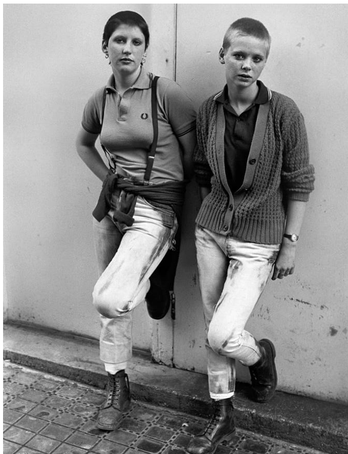
Imatge - 4 Dues skingirls, Derek Ridgers, The Guardian.

Un altre corrent molt poc explorat és el dels skins homosexuals nacionalsocialistes: els gayskins. S'organitzaren per primer cop el 1974 amb el partit National Socialist League, dels Estats Units. Aquesta postura va ser rebutjada per altres col·lectius homòfobs però es pot entendre que dins d'un moviment d'apologia al culte del cos sorgeixin individus interessats per l'estètica i a la masculinitat que promouen. En aquest sentit resulta interessant la història de Nicky Crane, que mentre militava a B&H assistia a clubs nocturns per a homosexuals 22 .