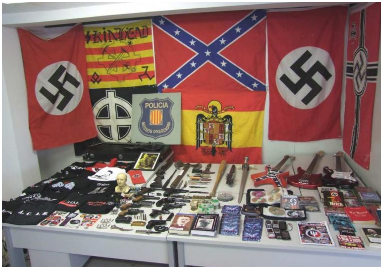
Imatge - 11 Material requisat als membres d'Hijos del Odio, Mossos d'Esquadra.

Gran part dels grups que han aparegut al llarg del treball col·laboraven amb la discogràfica censurada Rata-ta-ta-tá Records, o bé amb Desperta Ferro Records, amb seu a Llatinoamèrica que trasllada la música dels espanyols Iberian Wolfs o Celtiberian. Però hi ha moltes altres formacions que cerquen segells d'altres països, com QFFC Suicide Squad, Pit Records, Hate Records o SS Records. El grup de RAC d'El Masnou Jolly Rogers, però, ha trobat una discogràfica italiana que treballa amb grups musicals nacionalsocialistes discrets, que amaguen l'estètica neonazi però que mantenen el discurs xenòfob i racista. Tuono Records, amb qui he intentat contactar sense èxit en diverses ocasions, porta la gestió dels grups més actius actualment, com ara Irreductibles, Jolly Rogers o Bronson, però també ha publicat música de División 250 i d'altres bandes italianes.