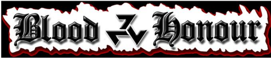
Imatge - 2 Logotip de Blood & Honour, Arxiu de l'organització.

paradoxalment també en territori sud-americà 13 malgrat les qüestions de puresa de raça.