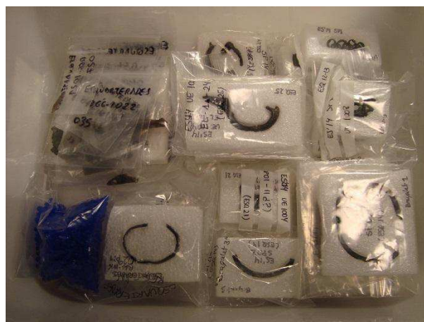
Figura 13. Caja donde se almacenan las piezas con gel de sílice.

El ICAC es un centro de investigación que se dedica a los estudios en Arqueología Clásica, y a pesar de no contar con una unidad en Conservación-Restauración como tal, en los últimos años, algunos de sus equipos de investigación están tomando conciencia de la importancia y necesidad de poder contar con técnicos en conservación-restauración. En consecuencia, la colaboración es cada vez más estrecha y está creciendo el interés, por parte de los distintos equipos del ICAC, en consolidar la restauración de materiales arqueológicos como una disciplina auxiliar de la arqueología, teniéndola en cuenta en todo el proceso de investigación, e insiriéndola en su funcionamiento.