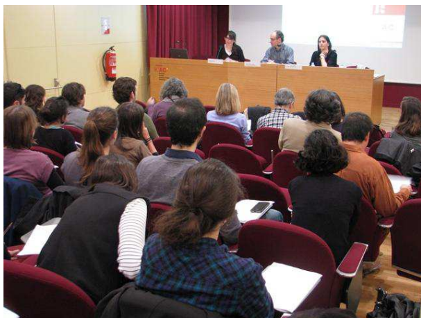
Figura 1. Salón de actos del ICAC durante la celebración del Seminario (marzo de 2015).

Este seminario pretende ser y crear un punto de encuentro entre arqueólogos y restauradores, donde se puedan dar a conocer los trabajos realizados en común.