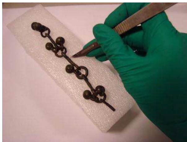
Figura 6. Preparación del sistema de embalaje y almacenaje (R-PNT6 UE 1001-1004).