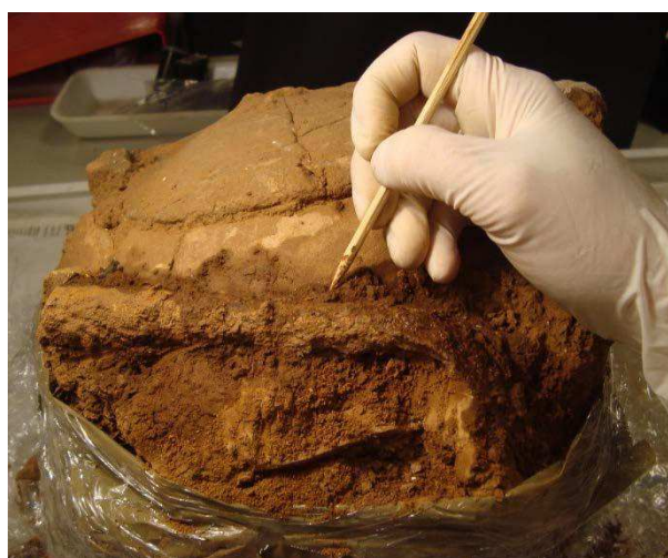
Figura 11. Ejemplo de la casuística n°3. SP19 en proceso de excavación.

3. Urnas con elementos de ajuar funerario metálico contenido en la tierra circundante exterior que se había mantenido para facilitar su traslado al laboratorio. En este caso se realiza en primer lugar la excavación de la tierra exterior, (por parte del restaurador) para poder recuperar los metales de la mejor manera posible con vistas a los posteriores trabajos de conservación-restauración en el laboratorio. Se sigue con la excavación del interior de la urna por parte del arqueólogo con la supervisión y ayuda del restaurador.