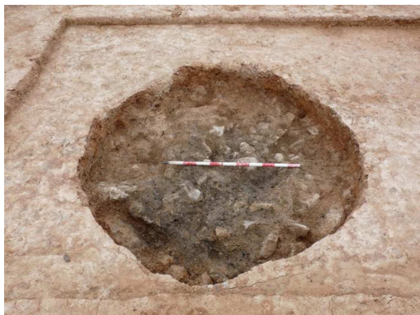
Figura 2. Silo del Pontarró (la Secuïta).

El silo fue amortizado a finales del siglo V o inicios del IV a.C, y entre los materiales de su relleno destaca un conjunto de elementos de ornamentación de bronce (aproximadamente 1kg de peso) y cerca de 6.000 cuentas de collar de vidrio, junto a materiales cerámicos, fusayolas, molinos, restos de fauna, de malacología (en su mayoría de Cypraea ) y restos arqueobotánicos.