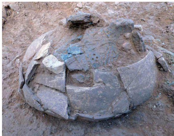
Figura 9. Restos de una urna correspondientes al Tipo 2

Tipo 2. Principalmente urnas recuperadas en la campaña de 2015, en la zona menos afectada por los trabajos agrícolas. Se presentan más completas (a pesar de estar fragmentadas por los procesos postdeposicionales), y con el ajuar metálico conservado a su lado o en su interior.