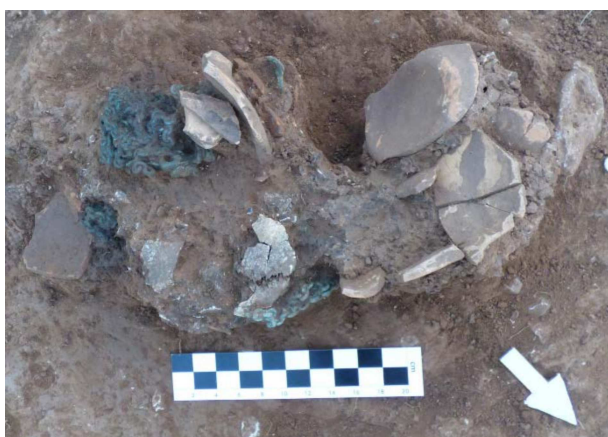
Figura 8. Restos de una urna y su ajuar funerario correspondientes al Tipo 1

Tipo 1. Principalmente urnas recuperadas durante la campaña del 2014, que provienen de la zona más afectada por los trabajos agrícolas. Las urnas y el ajuar asociado se presentan más dispersos, revueltos y en un pésimo estado de conservación.