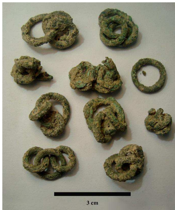
Figura 3. Muestra del estado inicial de algunas de las piezas de bronce a restaurar.

destinar algunas muestras a experimentar nuevas metodologías de limpieza, actualmente en curso.