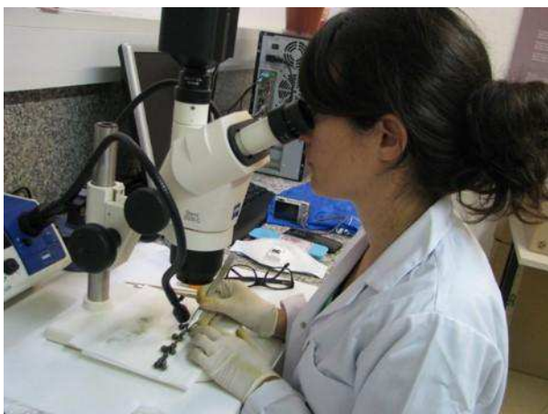
Figura 4. Técnico realizando trabajos de limpieza mecánica en el laboratorio del ICAC.