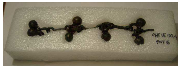
Figura 7. Presentación final de la pieza (R-PNT6 UE 1001-1004)

Todas las piezas se han guardado en cajas con gel de sílice para mantener una humedad relativa lo más estable posible. El estado del gel de sílice se controla periódicamente.