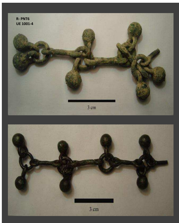
Figura 5. Pieza del yacimiento del Pontarró (R-PNT6 UE 1001-1004) antes (arriba) y después (abajo) del tratamiento.

Las piezas se han almacenado, finalmente, en camas de polietileno hechas a medida que se introducían en bolsas de plástico. Con estas camas se pretende facilitar el acceso de los arqueólogos a las piezas, una vez éstas entren en fase de estudio.