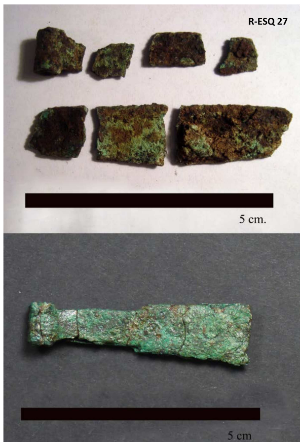
Figura 12. Pieza antes del tratamiento (R-ESQ 27) (arriba) y después (abajo)

Las piezas se han almacenado en camas de polietileno hechas a medida que se han introducido en bolsas de plástico. Con ello se pretende facilitar el acceso de los arqueólogos a las piezas, una vez éstas entren en fase de estudio.