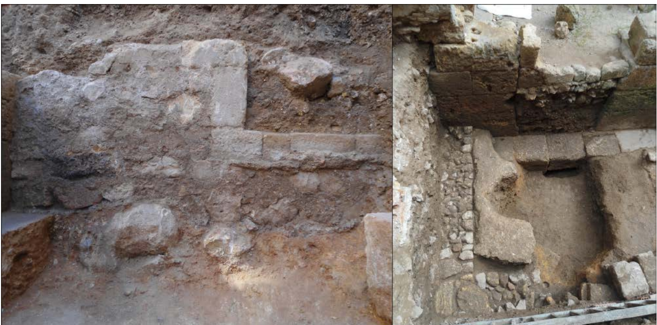
Figura 5. Detall de les construccions documentades al carrer del Trinquet Vell. A l'esquerra el mur de morter de calç amb la porta de pedra picada que tanca amb el podi del circ. A la dreta restes del mur i paviment de l'habitació construïda davant la porta del podi que donava accés a la volta del Trinquet Vell, 16 (Arxiu Codex).