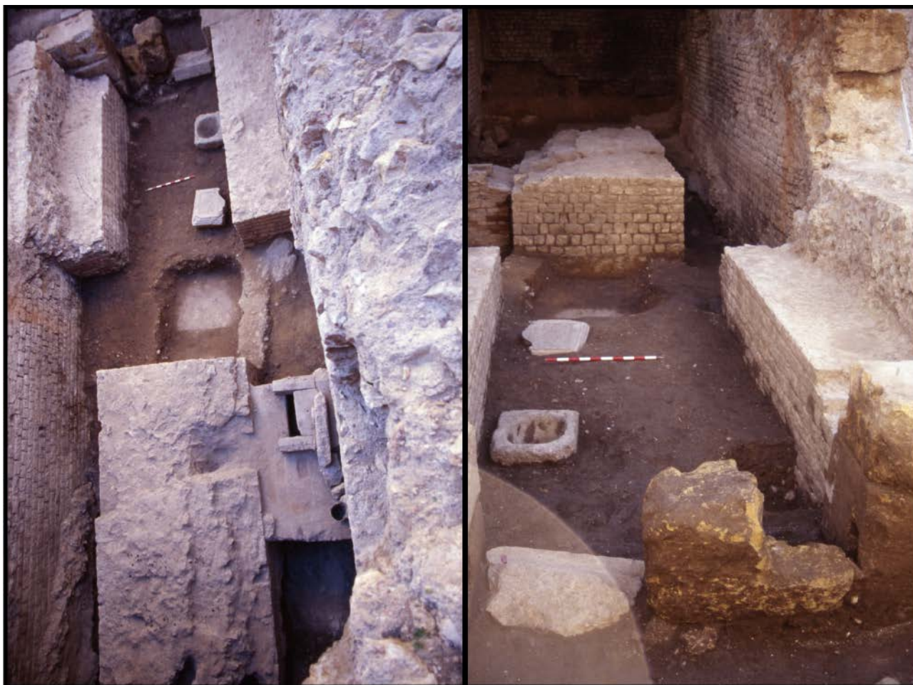
Figura 2. Excavació de la volta de Sedassos, 16. Nivell de pavimentació datat a finals del segle VI. Es pot observar al fons la reducció de l'accés a la volta i dos elements arquitectònics altimperials reutilitzats situats a la dreta del passadís d'entrada: el que sembla un capitell buidat per l'interior i la part superior d'un pedestal altimperial tallat. A la fotografia de la dreta, detall amb l'estretament de la porta en primer terme, i en segon terme el nucli de l'escala i les rampes laterals desmuntades fins a la cota ara visible (Arxiu Ll. Piñol).

Trinquet Vell, la transformació tardana és molt més visible. S'observa un rebaix general de les rampes laterals d'accés al replà, unificant la cota de circulació amb la de l'arena. A més, també es produeix un estretament de la porta oberta al podi, l'adosament de construccions al mur del podi aixecades sobre l'antiga arena, i la utilització de la summa cavea , desballestada i regularitzada, com a plataforma a cota de primer pis.