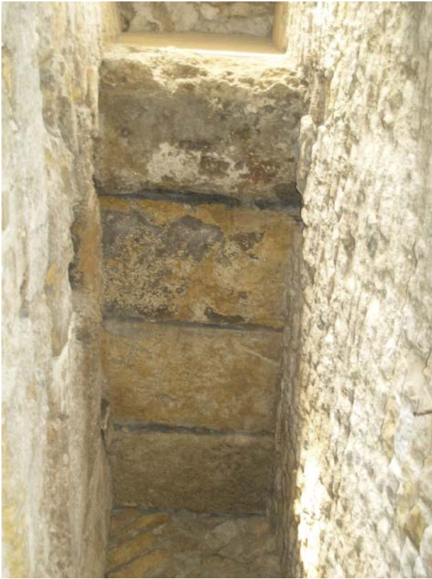
Figura 4. Detall interior de la volta del Trinquet Vell, 16. Coberta feta amb carreus disposats transversalment del passadís esquerra de la volta, resultant de la construcció del mur tardà fet amb els carreus reutilitzats de l'escalinata central d'accés a la summa cavea