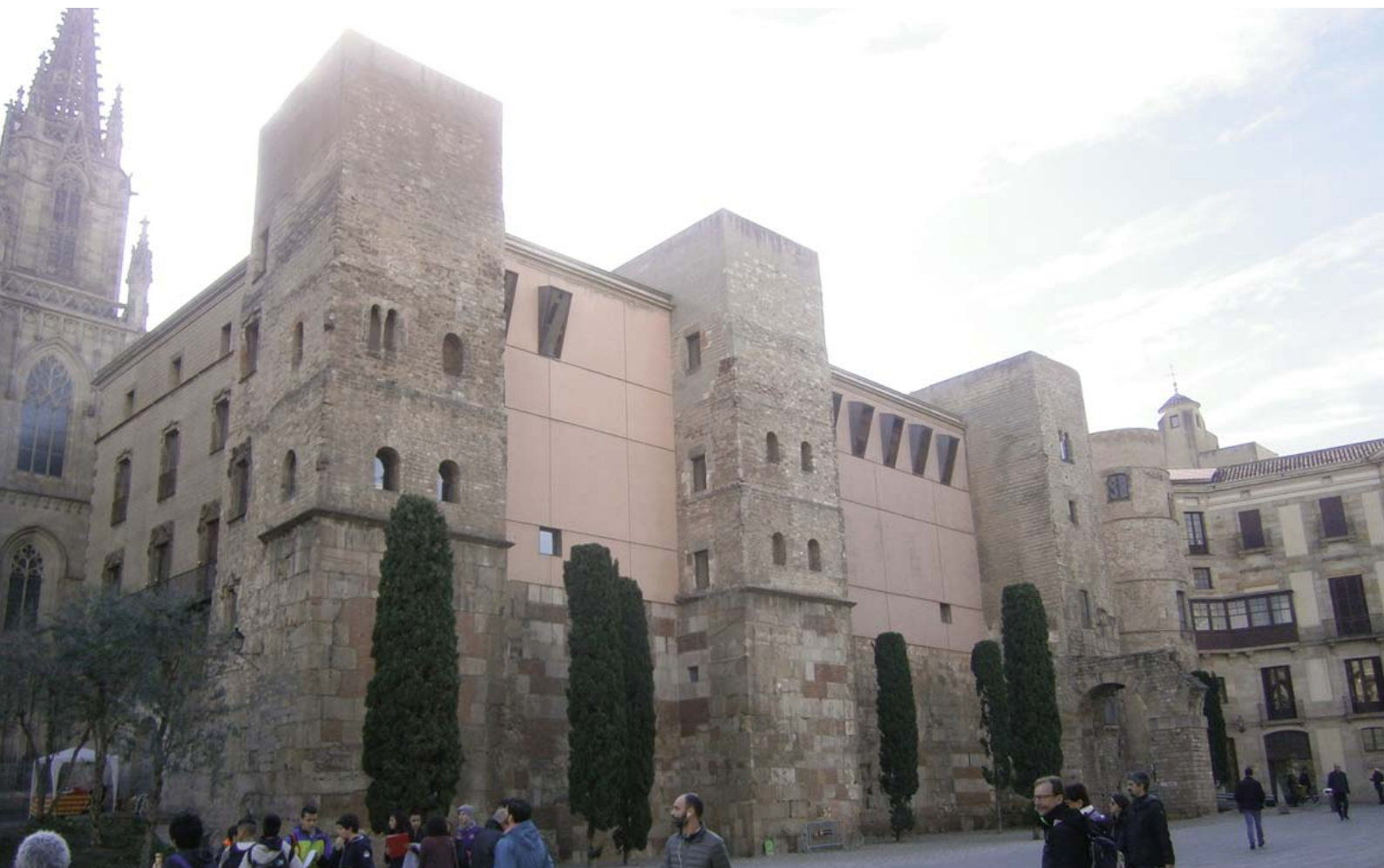
Vista des de l'exterior de la muralla baiximperial, restaurada i amb acreixements posteriors, a l'actual avinguda de la Catedral (A. Ravotto)

A l'hora de raonar sobre el conjunt, queda clar que ciutat i muralla augustals van ser el producte d'un únic concepte: la muralla definia la forma de la ciutat, donant-li la característica forma octagonal –que té una impressionant analogia amb el traçat de la muralla augustal d' Alba Pompeia (Alba, Piemont)– i, per tant, condicionava l'entramat viari; també funcionava con-