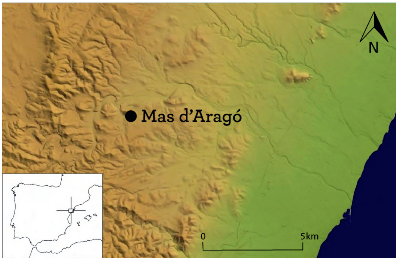
Figura 1. Ubicación geográfica de la figlina de Mas d'Aragó.