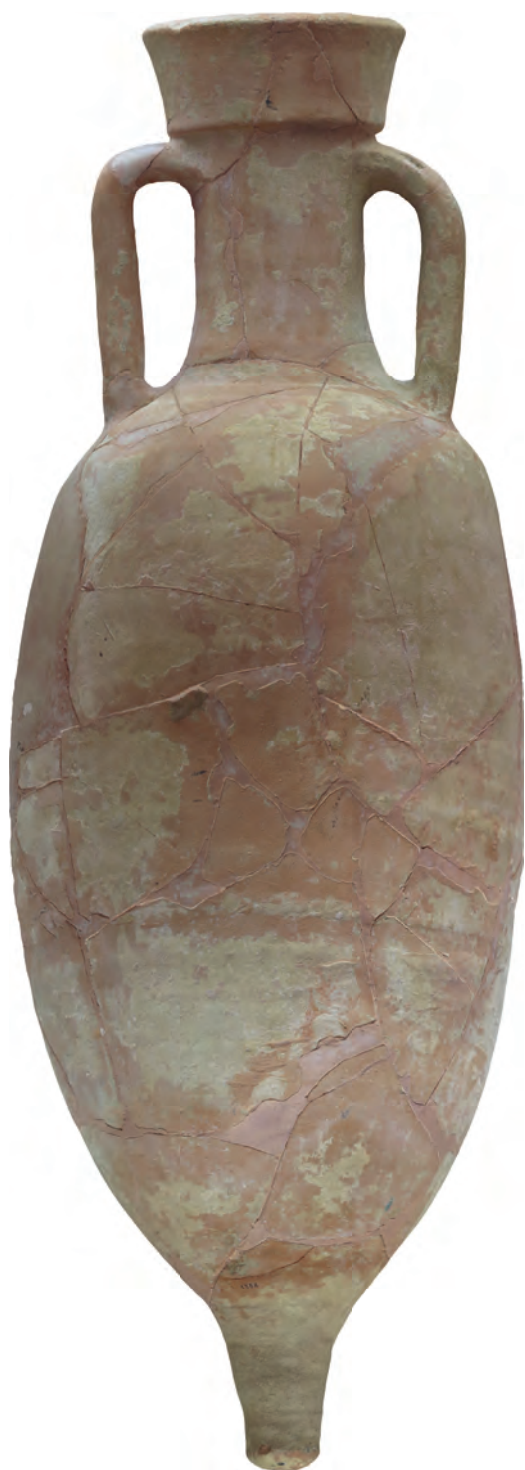
Figura 2. Ortoimagen de la Pascual 1 parva del Mas d'Aragó a partir del levantamiento fotogramétrico de la misma.

borde de unos 8 a 12 cm de altura y un macizo pivote casi cilíndrico de unos 15 cm de alto (Miró, 1988a: 70), el ejemplar de Mas d'Aragó mide tan sólo 0,86 m de altura (Fig. 3). El borde tiene una altura de 7 cm y un espesor en la parte superior de 1,1 cm. El diámetro de la boca es de 13,1 cm. Su perfil, a diferencia de las Pascual 1 "standard", que tienen un aspecto fusiforme, es marcadamente ovoide; por otro lado, el pivote pequeño y puntigudo nada tiene que ver con el macizo pivote de la forma Pascual 1 clásica. Por otro lado, el borde, alto, sí que corresponde al típico de la Pascual 1, así como las asas que, aun siendo más pequeñas de lo habitual en esta forma (debido al menor volumen del ánfora y a su perfil fusiforme) miden 3,6 cm de espesor y sí que presentan la característica de tener un diámetro de sección tubular (aunque algo más apaisada de lo normal) y el típico surco en el exterior.