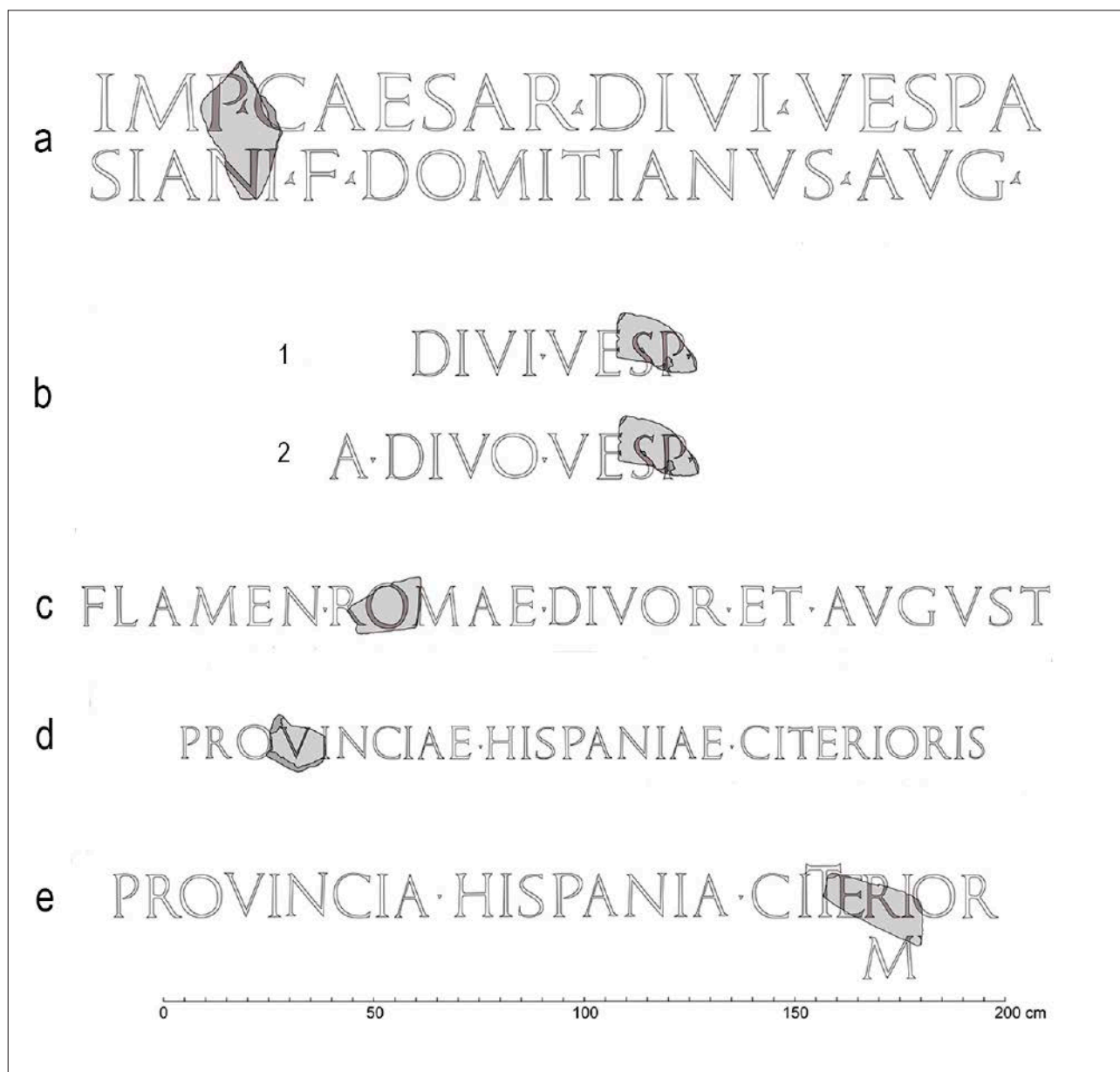
Figura 2. Restitución ideal de las secuencias de texto para cada uno de los fragmentos. Dibujo: Julio C. Ruiz.

un exiguo resto de astil curvo en el lado izquierdo y del astil vertical en su lado derecho, flanqueando la V. En este contexto, es posible reconocer la secuencia QVI y proponer, en consecuencia, la lectura [pr]ovi[ncia], siendo prácticamente seguro que se refiera a la propia Hispania citerior (fig. 2d).