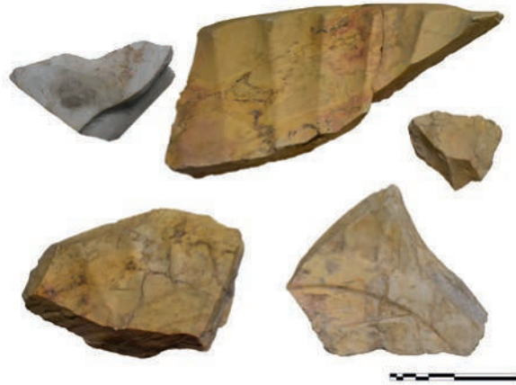
Figura 1. Fragmentos de labrum hallados en la villa de Els Antigons.

De la moldura, según los cálculos realizados a partir de los fragmentos conservados, surgirían aproximadamente treinta y seis elementos fusiformes imitando la superficie exterior de una concha, los cuales llegarían hasta el borde del labrum , finamente pulido, plano y completamente horizontal, el cual parece que tendría un diámetro máximo aproximado de 140 \pm 10 cm. La superficie externa de la cubeta, en cambio, está apenas desbastada y regularizada, careciendo de un mínimo pulido. Es posible que este tratamiento de la superficie exterior se debiera a que la pieza no se apoyaba en un pie exento, sino que se encontraba encastrada en una obra de mampostería, cosa habi-