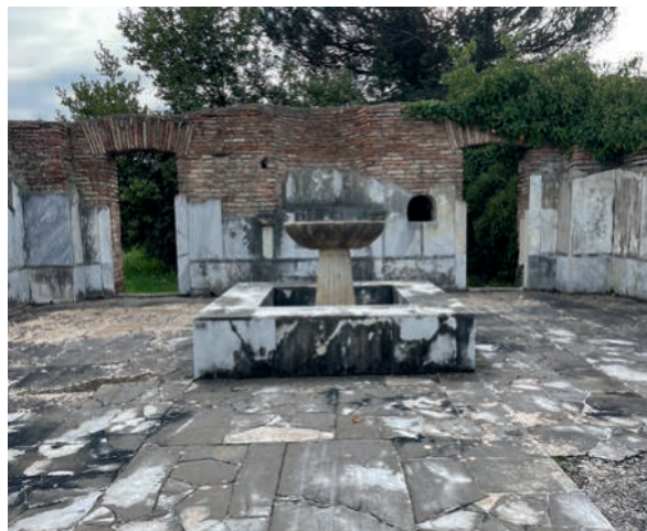
Figura 3. Labrum situado en el ninfeo de Eroses (Ostia Antica).

Otro paralelo de la misma tipología es el labrum del ninfeo de Eroses en Ostia (fig. 3), algo más pequeño en dimensiones, pero situado en el ángulo noreste del porticado central, ocupando el centro de un ninfeo datado en el siglo v. d.C., es decir, el mismo contexto que