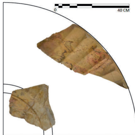
Figura 2. Cálculo de los diámetros originales del labrum.

tual en recipientes de este tamaño (Morillo y Salido, 2010), aunque no podemos descartar que se tratase de un ejemplar inacabado como dos de sus paralelos más semejantes. 6