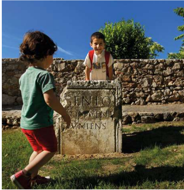
Pedestal corresponent al Genio / convent(us) / Cluniens(is) Passeig Arqueològic

d'interès, especialment fiscals o d'aprovisionament en anys d'escassetat, aprovar els comptes del mandat del flamen sortint i triar un nou flamen de la província per a l'any següent. On es reunia aquesta assemblea? Com veurem a continuació, una sèrie de pedestals dedicats als genis dels diferents convents jurídics ens poden donar la resposta.