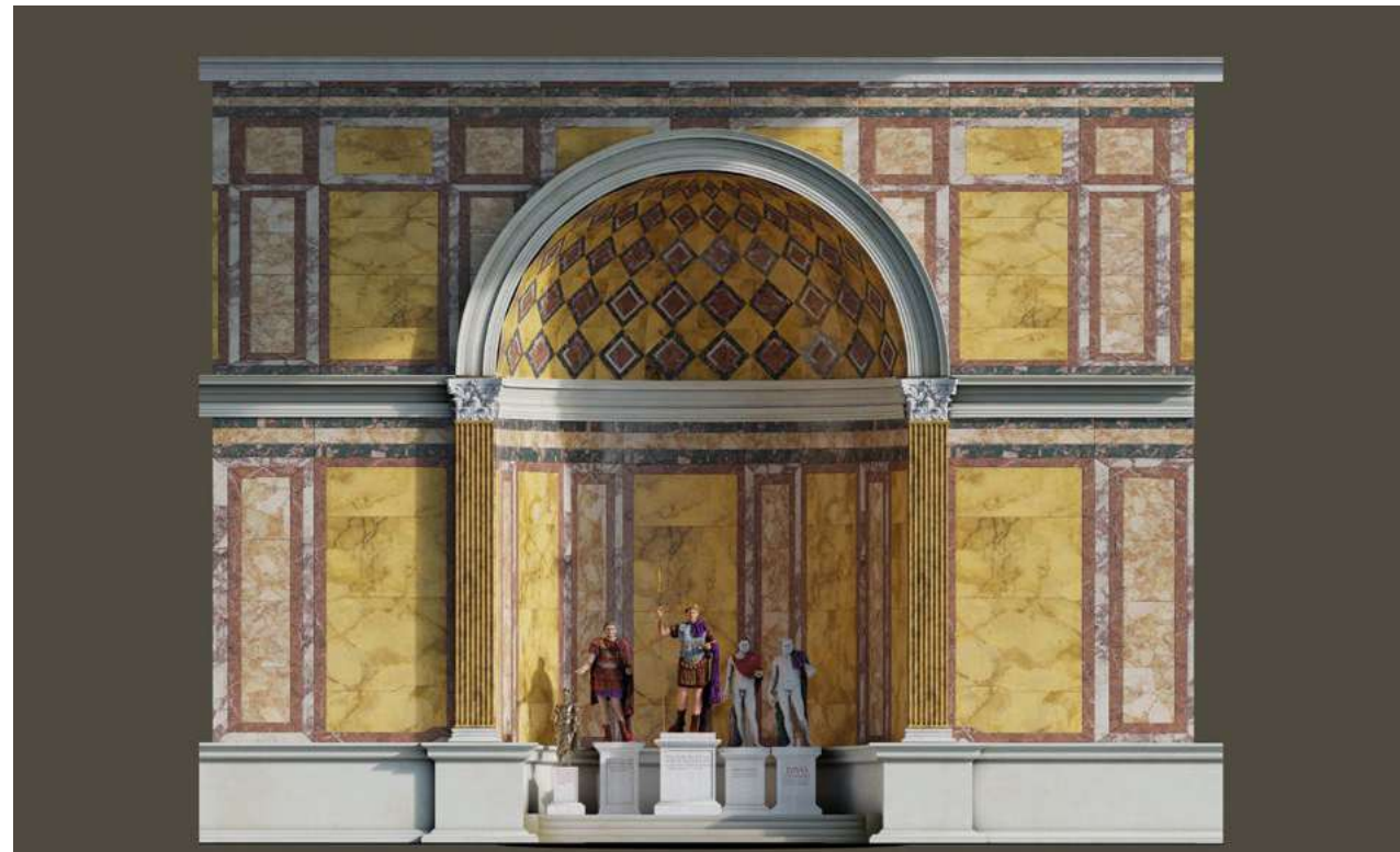
Recreació digital de la cella del temple d'August o l'aula flàvia SETOPANT (URV-ICAC)

amb les columnes dels porticats. Als dos extrems del pòrtic posterior, els dos pòrtics laterals acabaven en àmplies exedres amb portes de 7,70 metres de llum. I al centre de les naus laterals també hi havia altres exedres rectangulars de caràcter monumental.