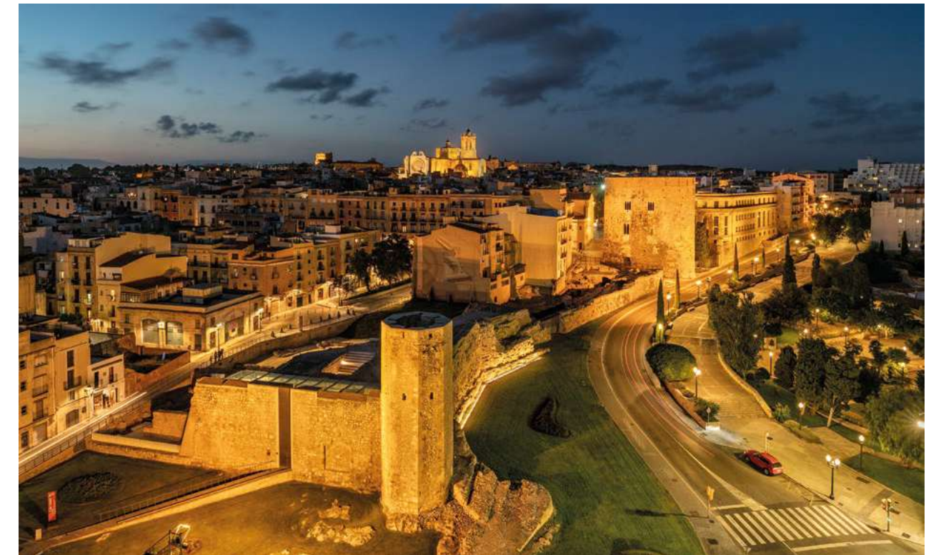
Vista de la Part Alta de Tarragona amb la capçalera del circ recuperada en primer terme

Un problema diferent, però de més importància des del punt de vista de la vida ciutadana, és la presa de decisions sobre la conservació i el tractament de les restes arqueològiques. Resulta imprescindible arribar a una definició precisa i legalment vàlida dels criteris que permetin establir un cert equilibri entre el que es destrueix i el que es conserva. Només des de la perspectiva del tractament global del problema arqueològic sobre la base de la seqüència excavació-estudi-museïtzació estarem en condicions de convertir l'arqueologia urbana en un instrument realment útil per saber construir el futur immediat de la nostra ciutat. Per a això ja disposem del marc legal adequat, institucions responsables i una tradició d'estudis i professionals preparats. Falta únicament assolir un consens suficient. I això és bàsicament una qüestió de voluntats.