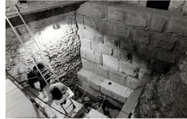
Excavacions a l'interior de l'Antiga Audiència, 1986