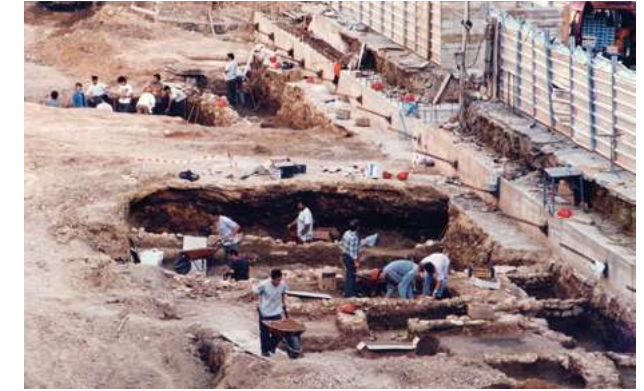
Excavacions a l'aparcament de la plaça de la Font, 1996 Aj. de Tarragona. Centre d'Imatges de Tarragona / L'Arxiu. Vallvé

el projecte de la seva nova seu en uns solars de la Part Alta molt pròxims a la catedral. Per primera vegada a Tarragona, es va poder dur a terme una excavació arqueològica extensiva com a estudi previ a la realització d'un projecte arquitectònic. Acabada l'excavació, les restes aparegudes van ser integrades de diferents maneres en el nou edifici. Després de la seva inauguració, la mateixa institució va sufragar la publicació dels resultats obtinguts.