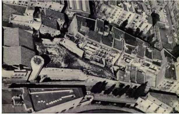
La capçalera del Circ abans de les tasques de recuperació, s/d