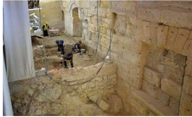
Excavacions al claustre de la catedral, 2023

La informació arqueològica reunida en aquests centenars i centenars d'excavacions efectuades s'ha recollit en funció de la distribució de solars, amb la consegüent fragmentació de les dades. La noció de jaciment unitari que hauria de tenir una ciutat històrica ha quedat segmentada segons les necessitats del desenvolupament