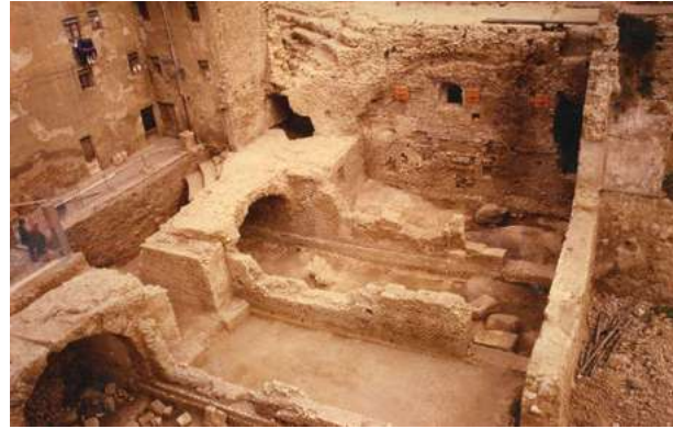
La capçalera del circ des del carrer de Sant Oleguer, 1990