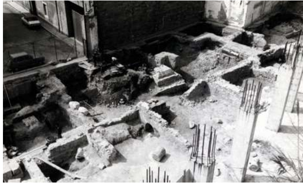
Excavacions arqueològiques al teatre romà, s/d

moment havien estat treballant sense interrupció. Però la situació, anys després, s'ha anat recuperant lentament i de manera exponencial. El nombre d'excavacions autoritzades des de l'1 de gener de 2007 fins al 31 de desembre de 2022 va estar de 1.848, una xifra que causa impressió.