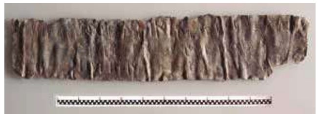
Fig. 4. Plom amb inscripció ibèrica aparegut a l'edifici de la zona 8.

Fins avui (CAMAÑES, PADRÓS, PRINCIPAL 2017), s'hi han excavat nou zones, totes datades entre 125 i 75 a. n. e., sense que s'hagin detectat restes d'ocupació humana ni anteriors ni posteriors a aquesta cronologia. Així doncs, la urbanització del turó i la construcció de l'assentament degueren tenir lloc cap al final del tercer quart del segle II a. n. e., en un moment ja plenament de dominació romana.