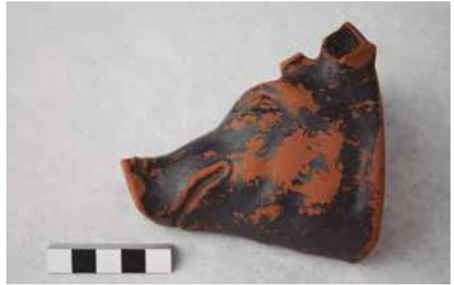
Fig. 3. Asc de vernís negre italià, en forma de cap de porc, aparegut a l'edifici de la zona 8.

El jaciment ocupa gairebé la totalitat de la plataforma superior del turó, d'uns 18.000 m 2 , i devia estar delimitat per un mur perimetral o muralla, que s'ha documentat de manera parcial en diversos espais, ajustant-se a la topografia de l'indret. És un turó de difícil accés, i disposa d'un control visual privilegiat sobre el riu (nord-sud) i la plana, cap al sud, fins a l'actual ciutat de Lleida (antiga Ilerda). Per tant, en funció de la seva ubicació geogràfica, Monteró és un excel·lent punt estratègic des del qual es pot controlar fàcilment el territori i la seva xarxa de comunicacions.