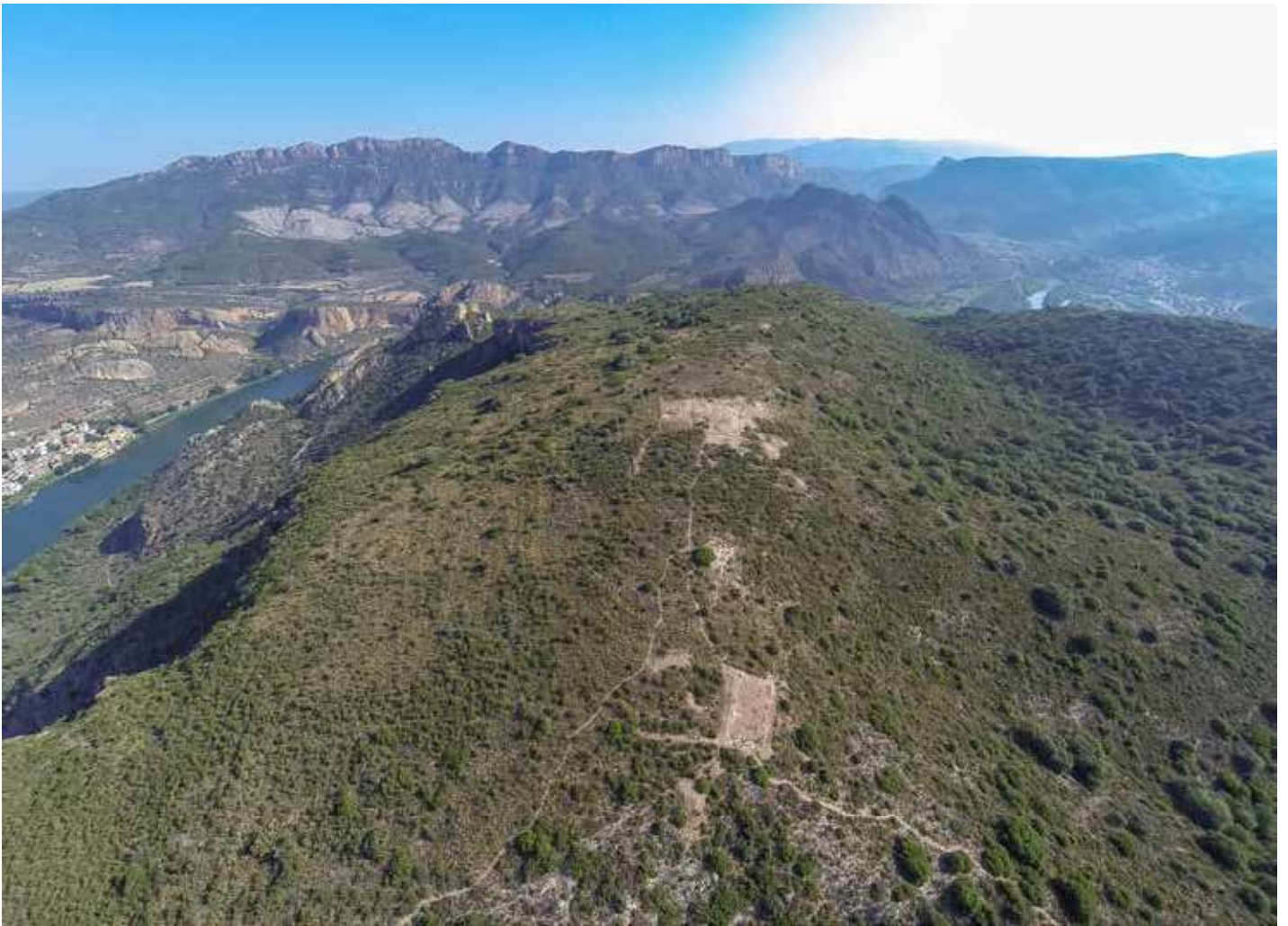
Vista de l'altiplà de Monteró des del sud. Zona 9 (torre), en primer terme.