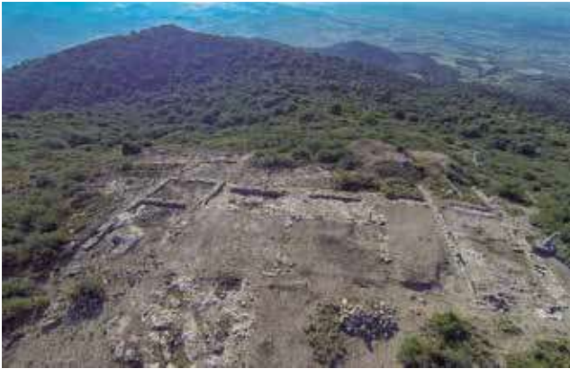
Fig. 2. Vista de les restes de l'edifici de la zona 1 ( praesidium ), des de l'oest.

treballs recents sobre logística militar romana que apunten que només un exèrcit sofisticat avesat a operacions de guerra a gran escala, com el de la República Mitjana/Tardana, hauria tingut la capacitat d'organitzar una xarxa d'espais logístics, defensada per guarnicions territorials, en què es reunissin i guardessin recursos militars, per a l'ús dels exèrcits en trànsit (ROTH 1999: 187-188).