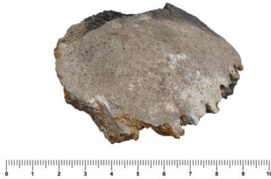
Figura 12.4. Tall fet amb un objecte afilat en un fragment cremat del parietal. S'hi observa l'impacte de l'arma.