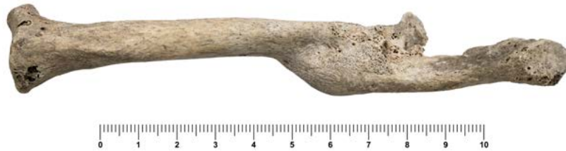
Figura 12.5. Fractura ante mortem amb encavalcament a la clavícula dreta.