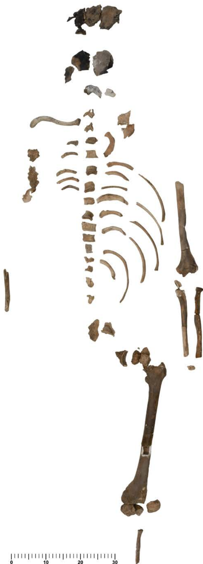
Figura 12.1. Individu UE 96/4609.

S'observen petits osteòfits als cossos vertebrals, és a dir que hi ha formació d'espícules d'os relacionades amb l'artrosi. L'artrosi a la columna es relaciona amb l'edat, tot i que una activitat física exigent en pot comportar l'aparició abans dels 40 anys (Roberts, Manchester, 2010). L'individu també presenta un nòdul de Schmörl al cos d'una vèrtebra dorsal indeterminada, amb una mida de 4,5 \times 3,2 mm. Es tracta d'una herniació del nucli polpós del disc intervertebral que no ha arribat a creuar l' annulus fibrosus . Els nòduls de Schmörl, d'etologia complexa, es relacionen amb l'activitat i en individus joves s'han associat a un esforç físic continuat (Capasso, 1991).