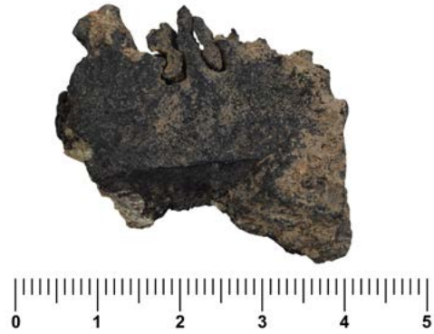
Figura 12.3. Tall provocat per un objecte afilat en un fragment cremat de l'occipital. S'hi observa l'impacte de l'arma.