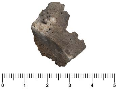
Figura 12.2. Tall fet amb un objecte afilat en un fragment cremat del parietal.