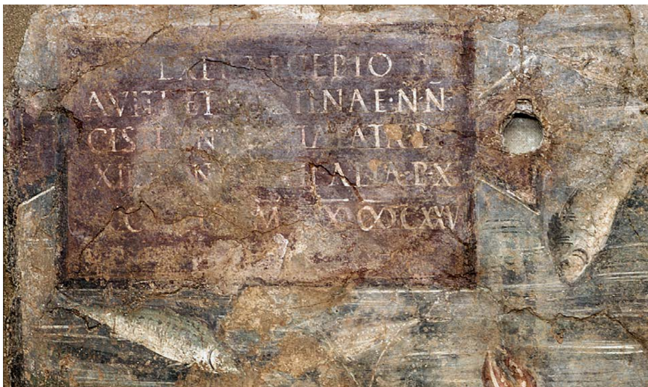
Figura 4.2. Detalle del titulus pictus en tabula ansata.

3,2 cm de altura. Las letras son latinas y de tipo capital cuadrado con refuerzos. Debido al estado de conservación de la superficie no puede confirmarse el uso sistemático de interpunciones, que, cuando son discernibles, tienen forma de punto o bien de raya horizontal —diagonal en el caso de n·n· (l. 2)—. Fue exhumado durante la campaña arqueológica iniciada por el MNAT a fines de 1995 (Tarrats et alii 1998b, 48-51) en la estancia 2.7 (4600) por la que se accedía a las habitaciones 2.6 (4500) y 2.9 (figuras 2.49, 2.62-264 y 3.23-3.27). La pintura cubre la pared que tapió el paso a esta última habitación (2.9) para convertirla en la cisterna a la que alude la inscripción (figuras 4.1 y 4.2). Perforan la pared dos tubos de plomo, uno en la parte superior, que parece servir de rebosadero y atraviesa la pintura exactamente a la altura del asa derecha de la tabula , y otro, posterior, en la parte inferior. En el interior de la cisterna se halló una cabeza de Antínoo. 16 La pintura se conserva expuesta en el centro de interpretación de la villa con el número de inventario MNAT 45207.