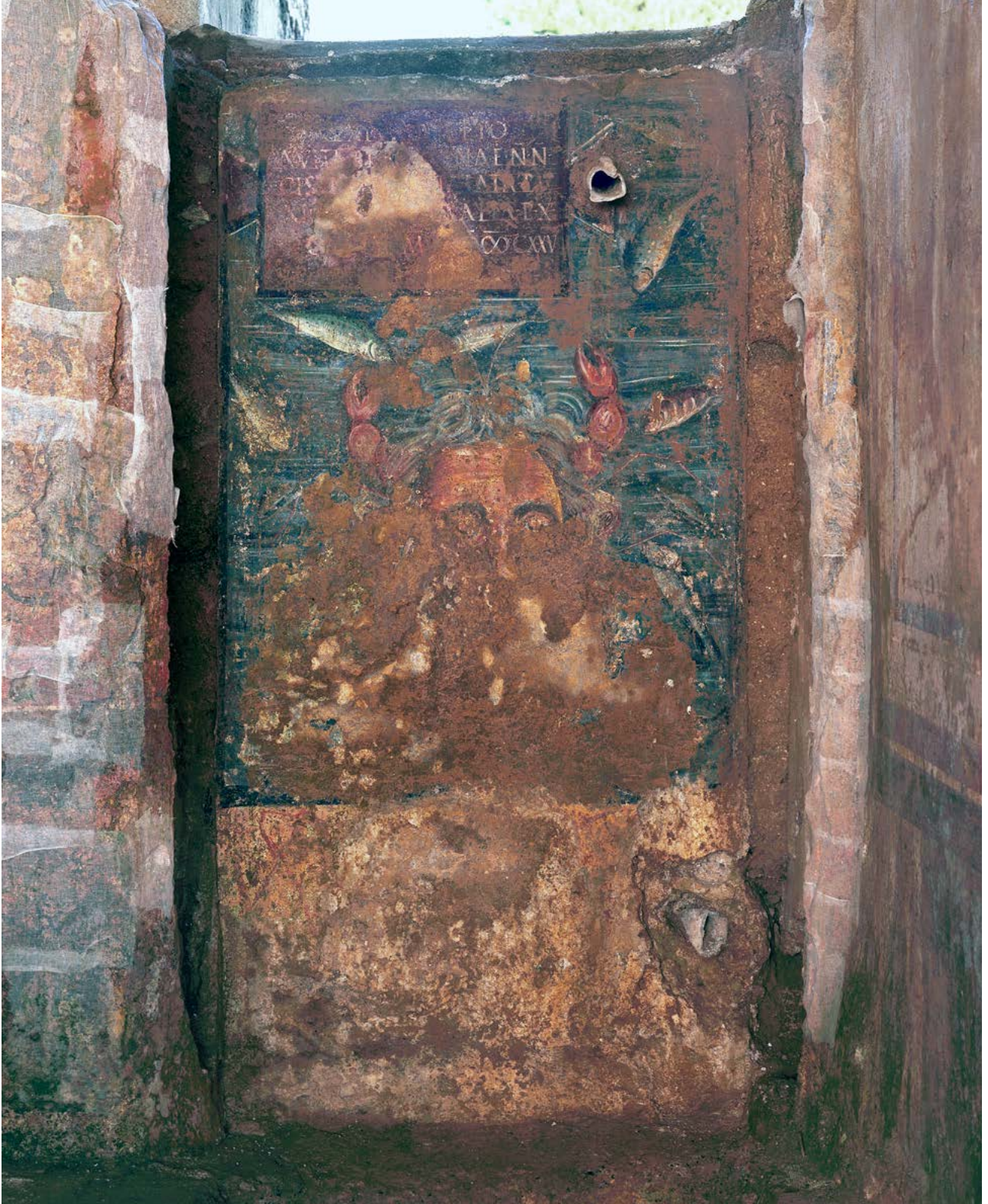
Figura 4.1. Mural con la representación de Océano (MNAT 45207).

Titulus pictus en letras blancas sobre tabula ansata de color burdeos situada en la parte superior izquierda de un conjunto pictórico que representa a Océano —de quien se aprecia solo la parte superior de la cabeza— con un mar repleto de peces por fondo. La superficie muestra un deterioro superficial por concreción calcárea que afecta a la zona inferior de la pintura y dificulta la lectura de la parte central izquierda del epígrafe, en la que algunas letras de las líneas 3-5 resultan ilegibles. La tabula mide 34-35 × 55 cm. Dos líneas blancas delimitan en cada renglón la caja de escritura, que tiene