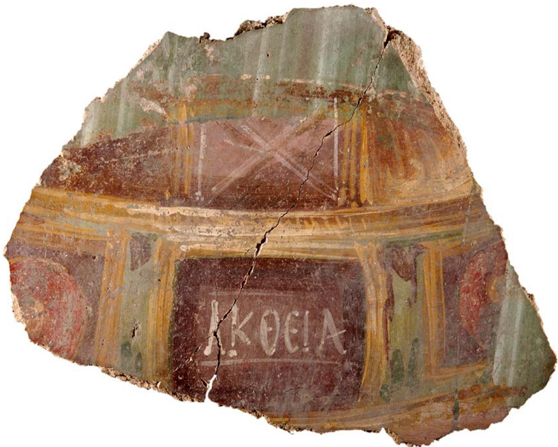
Figura 4.5. Corona de los Juegos de Accio (Archivo MNAT).

La inscripción está pintada, como la anterior, sobre fondo de color burdeos con letras blancas igualmente delimitadas por arriba y por abajo por dos líneas horizontales, la superior también más corta