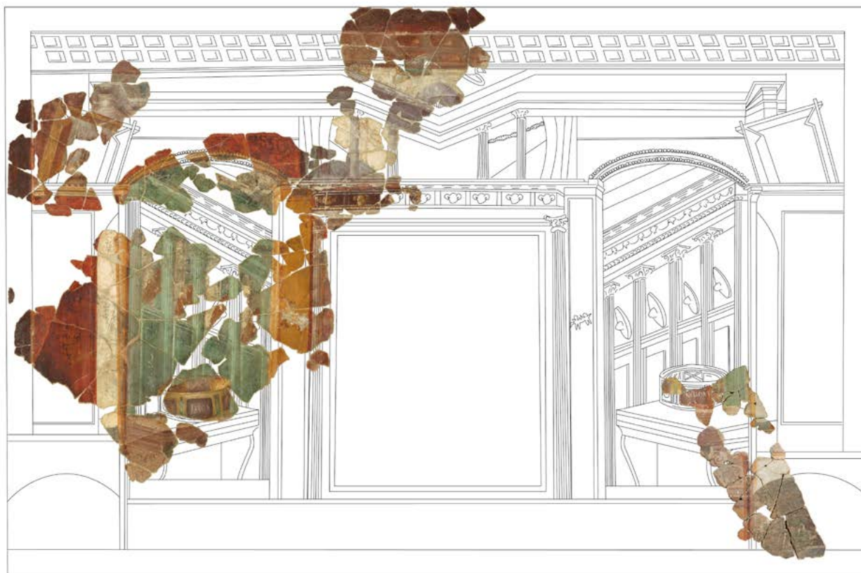
Figura 4.3. Reconstrucción de la pintura con coronas agonísticas con tituli picti en griego (C. Guiral, Archivo MNAT).

149), una circunstancia que impide contar con un contexto arqueológico preciso que facilite su datación. Las pinturas, en principio, podrían pertenecer tanto a las reformas realizadas por el augustobrigense Gayo Valerio Avito en época de Antonino Pío y Marco Aurelio cuanto a la fase previa de la villa, verosíblemente de época de Adriano.