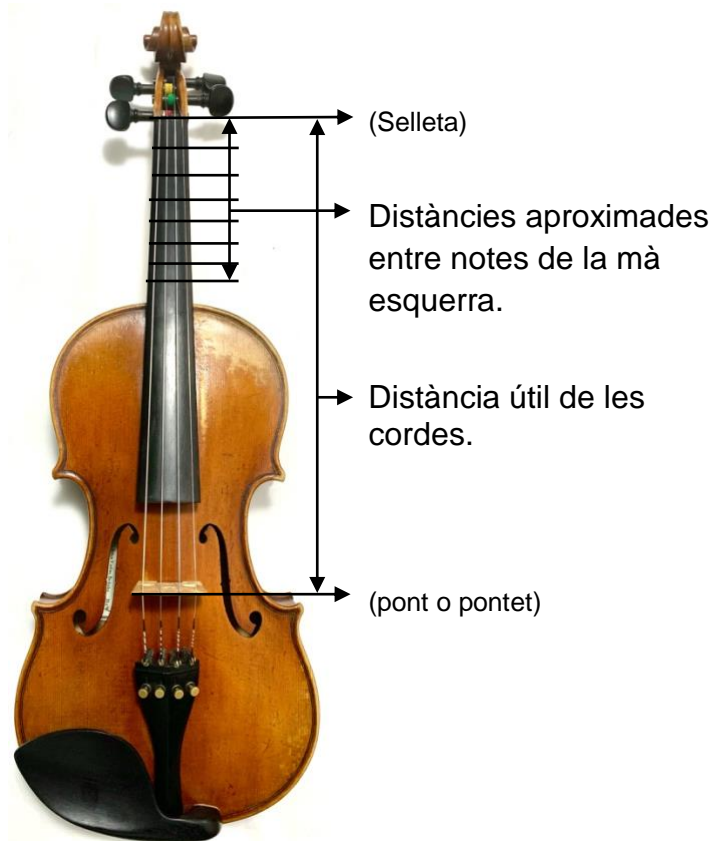
Il·lustració 1: Explicació visual de la distància útil de les cordes i la distància entre notes de la mà esquerra en un violí convencional.