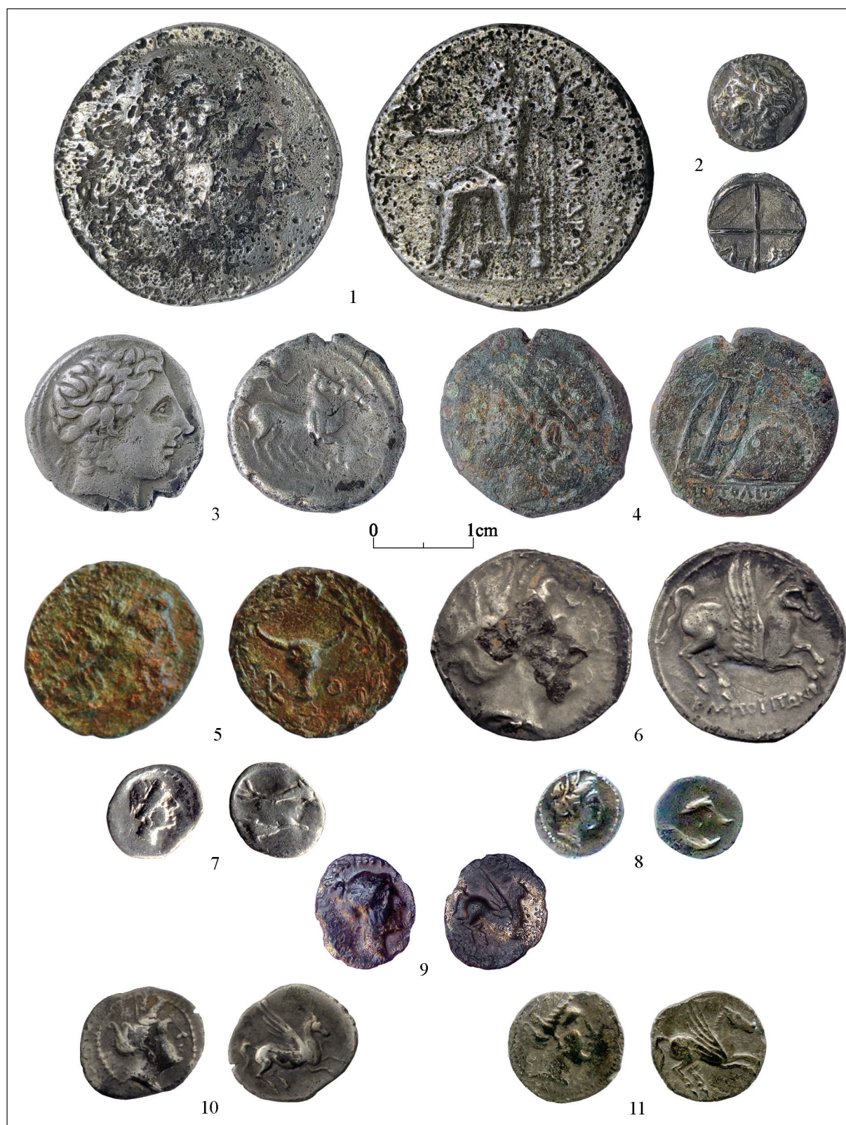
Fig. 3.- Les Masietes (Vespella): 1: tetradracma d'Alexandre. Bellavista (Nulles): 2: òbol massaliota; 3: dracma gal·la tipus Bridiers. Mas Passamaner (La Selva del Camp): 4: unitat de Neàpolis. L'Assut (Tivenys): 5: bronze de Corcira. La Palma-Nova Classis, monedes d'Emporion: 6: dracma; 7-8: tetartemoria; 9-11: tritartemoria.