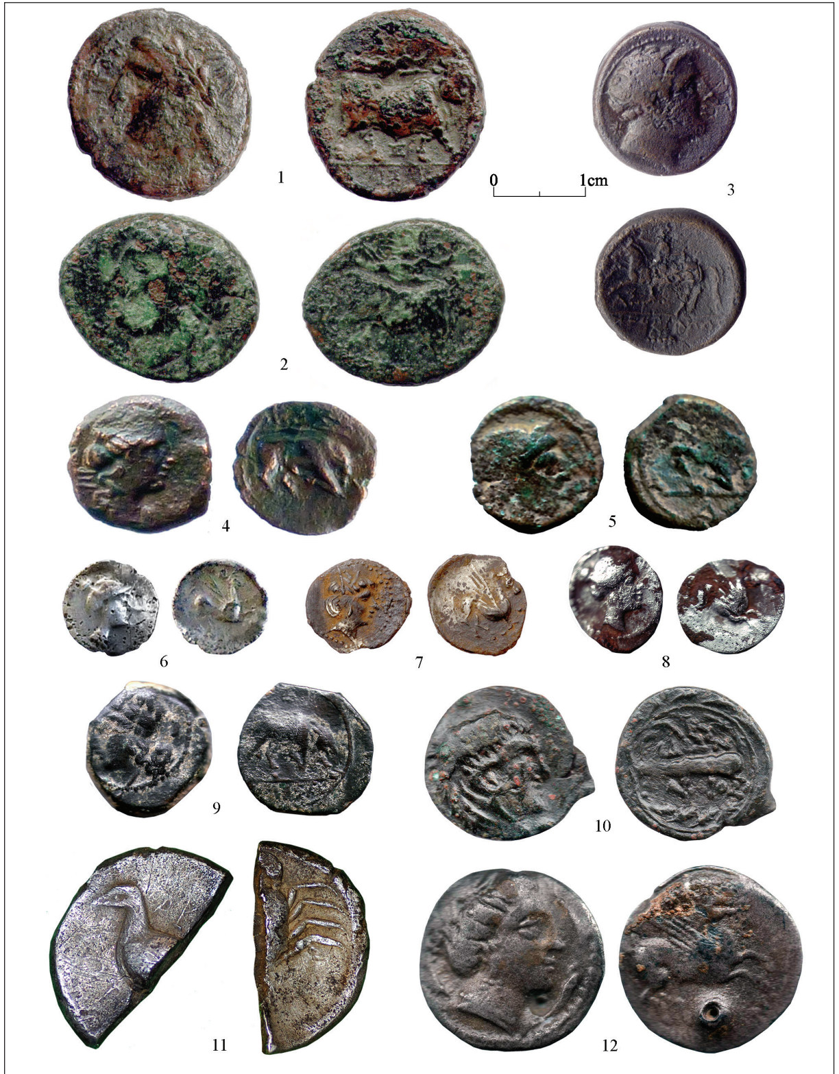
Fig. 5.- La Palma-Nova Classis (l'Aldea): 1-3: bronzes de Neàpolis. Les Tres Cales (l'Ametlla de Mar): 4-5: hemiòbols de Massàlia; 6-7: tritartemoria emporitans. Les Aixalelles (Ascó): 8: tritartemorion emporità; 9: hemiòbol de Massàlia; 10: bronze de Leucas. Les Esquarterades (Ulldecona): 11: tetradracma d' Akragas ; 12: dracma emporitana.