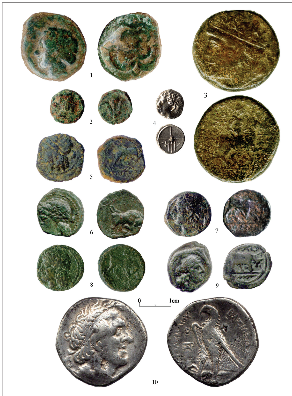
Fig. 4.- La Palma-Nova Classis (l'Aldea): 1-2: unitat i divisor de Rhode ; 3: bronze de Siracusa; 4: òbol de Massàlia; 5-9: hemiòbols de Massàlia; 10: tetradracma de Ptolomeu I Sòter.