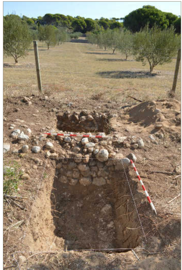
Figura 2. Sondeig en un mur del parcel·lari a Mas Cremat 1 (Torroella de Montgrí)

En les intervencions del 2017 i del 2018 va excavar-se un total de 17 sondejos en diverses traves viàries i murs en pedra laterals relacionats amb l'espai agrari (Fig. 1 i 2). En general, els resultats reforcen la hipòtesi de l'origen antic del parcel·lari per la presència de paleosòls als perfils estratigràfics i de murs més antics a la base de les estructures modernes, associats a la presència de ceràmica antiga. Les prospeccions documenten també concentracions de material arqueològic en determinats encreuaments de traves de camins. Els sondejos més conclouents han estat a les estructures situades a Mas Cremat (Mas Cremat 1 i 2) i al «Camí de Santa Maria del Palau». En aquests casos els resultats permeten proposar la cronologia antiga per a la primera fase dels murs, i relacionar-los amb la trama en estudi.