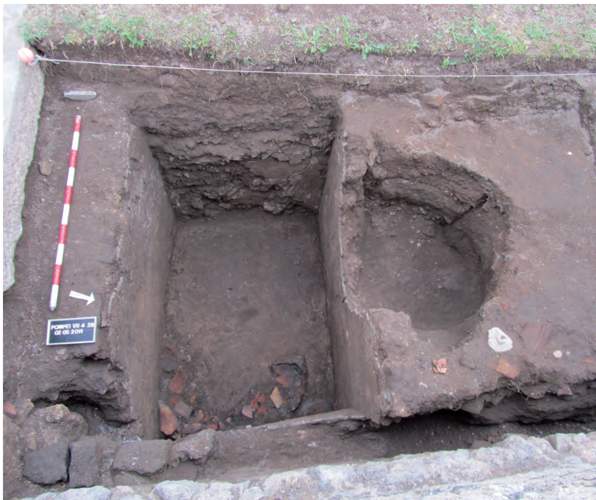
Figura 6: Taberna 28. La balsa una vez excavada.

La pileta corta al gran relleno de nivelación de la primera mitad del siglo II a. C. y su fecha de amortización se dataría 120 a. C., por lo que funcionaría unos 40-60 años.