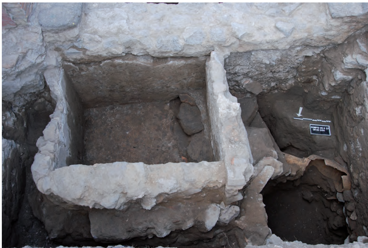
Figura 8: Taberna 27. Balsa sobre el pozo.

La de la taberna 28 estaba construida con mampostería irregular (fig. 9), fragmentos de tufo de pequeño tamaño, otros elementos volcánicos y cerámica variada (tres pondera , común, tegula , testae ). Las dimensiones interiores son 1,74 metros norte-sur, 1,07 metros este-oeste y un grosor de muro de 20-21 cm, y una altura de 63 cm. La balsa se apoya sobre el muro perimetral oriental de la taberna, que actúa como flanco este de la pileta.