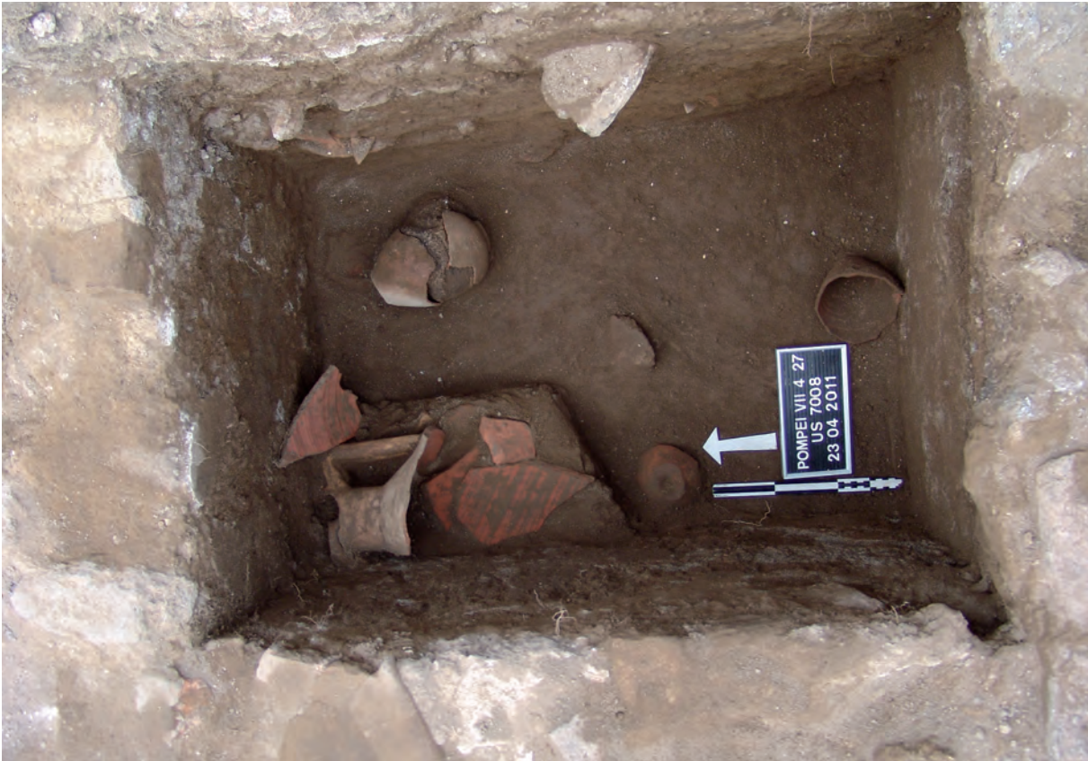
Figura 10: Taberna 27. Relleno de amortización de la balsa con macetas.