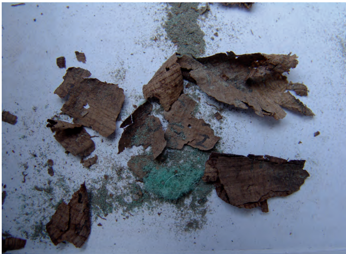
Figura 17: Taberna 26. Restos de papiro del interior del mango de la balanza.