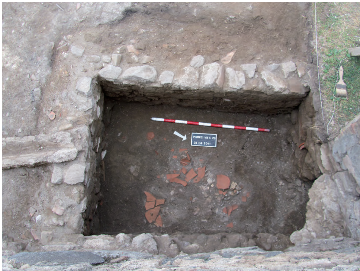
Figura 9: Taberna 28. Proceso de excavación de la balsa.

En su zanja de cimentación había sigillata itálica Consp. 5.4.2., 7 o 12 y paredes finas Mayet 33, que datan el relleno en época de Augusto.