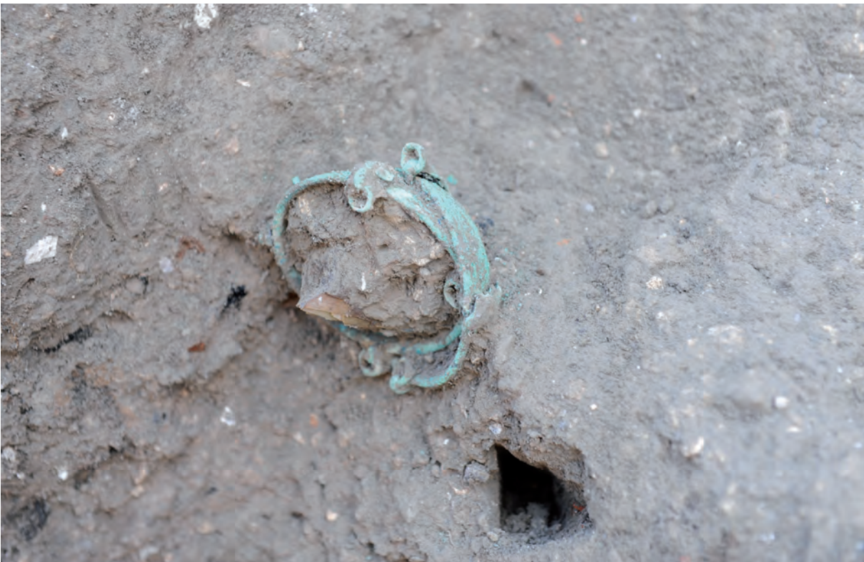
Figura 15: Taberna 26. Platos de una balanza entre el lapilli.