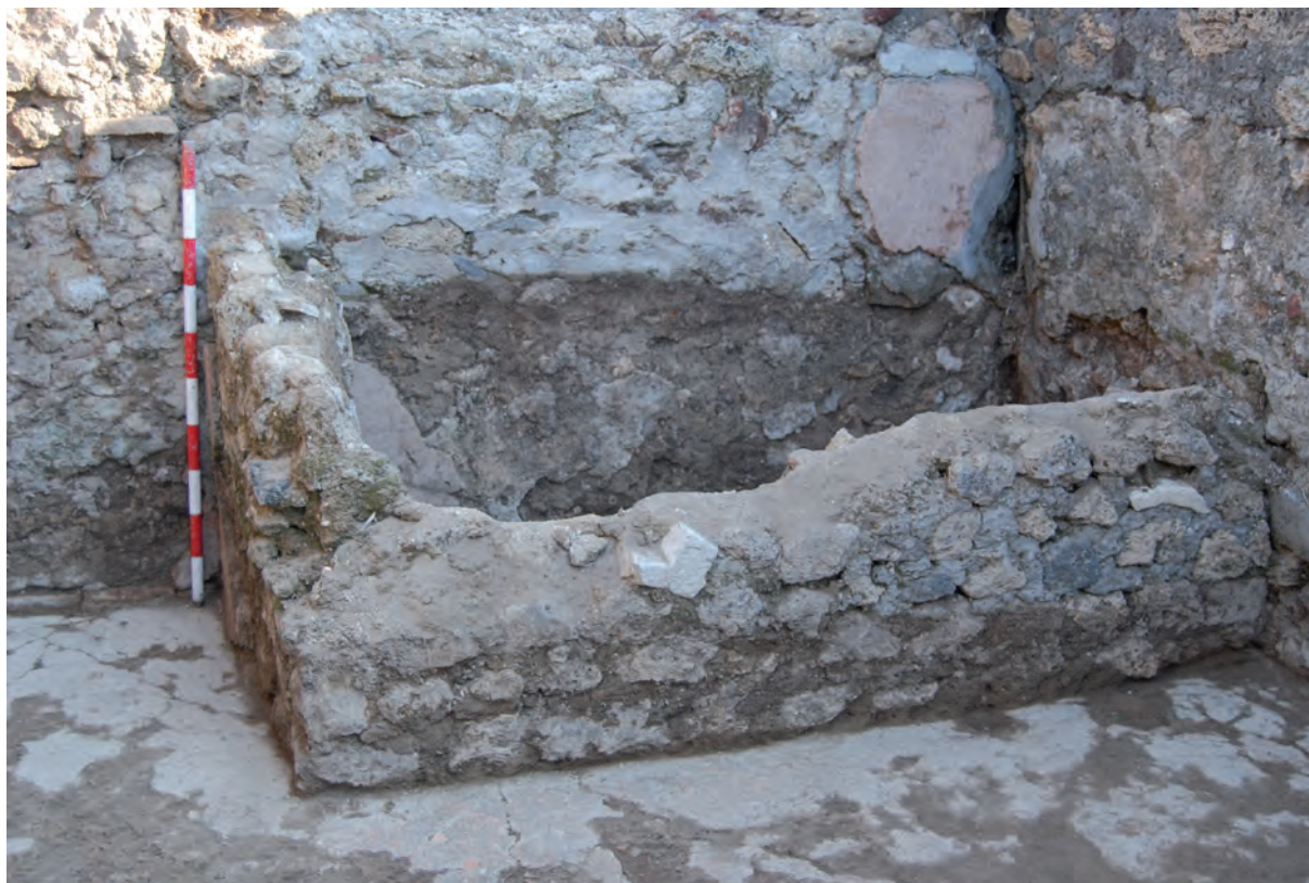
Figura 12: Taberna 27. La última balsa.