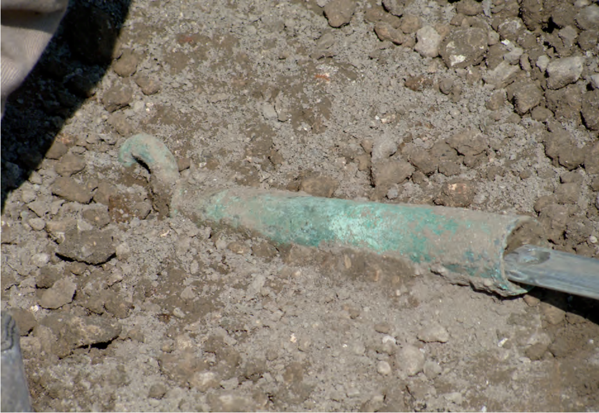
Figura 14: Taberna 26. Brazo de una balanza entre el lapilli.