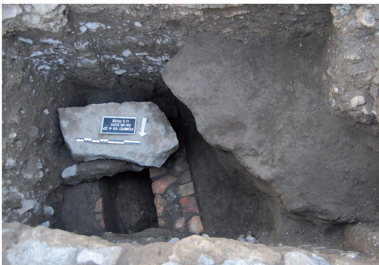
Figura 5: Taberna 27. Canal por debajo de la acera.

Sus paredes están formadas de mampuestos de calcárea con fragmentos de ánfora incrustados. El interior mide 28 cm de profundidad y 35 cm de ancho. Está recubierta por losas de basalto de unas dimensiones medias de 60 cm de largo, 15 cm de espesor y 30 cm de ancho.