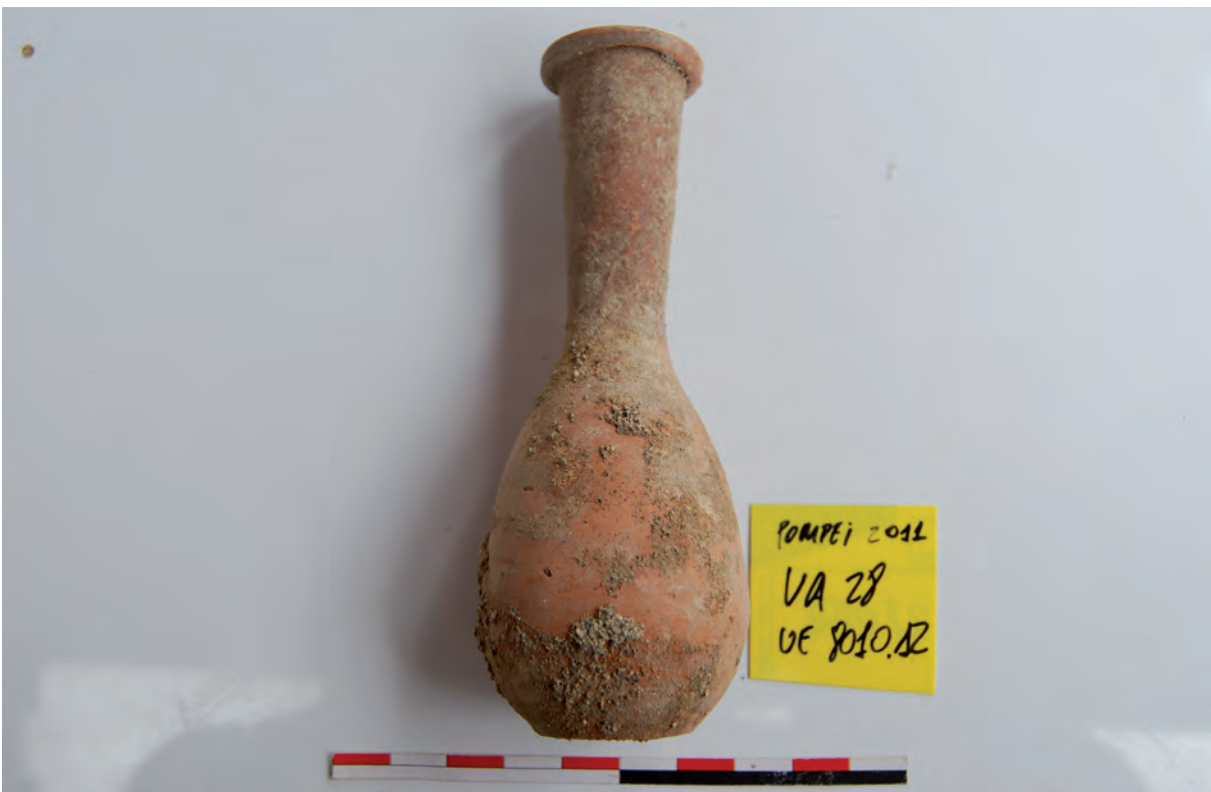
Figura 11: Taberna 28. Ungüentario del relleno de la balsa.