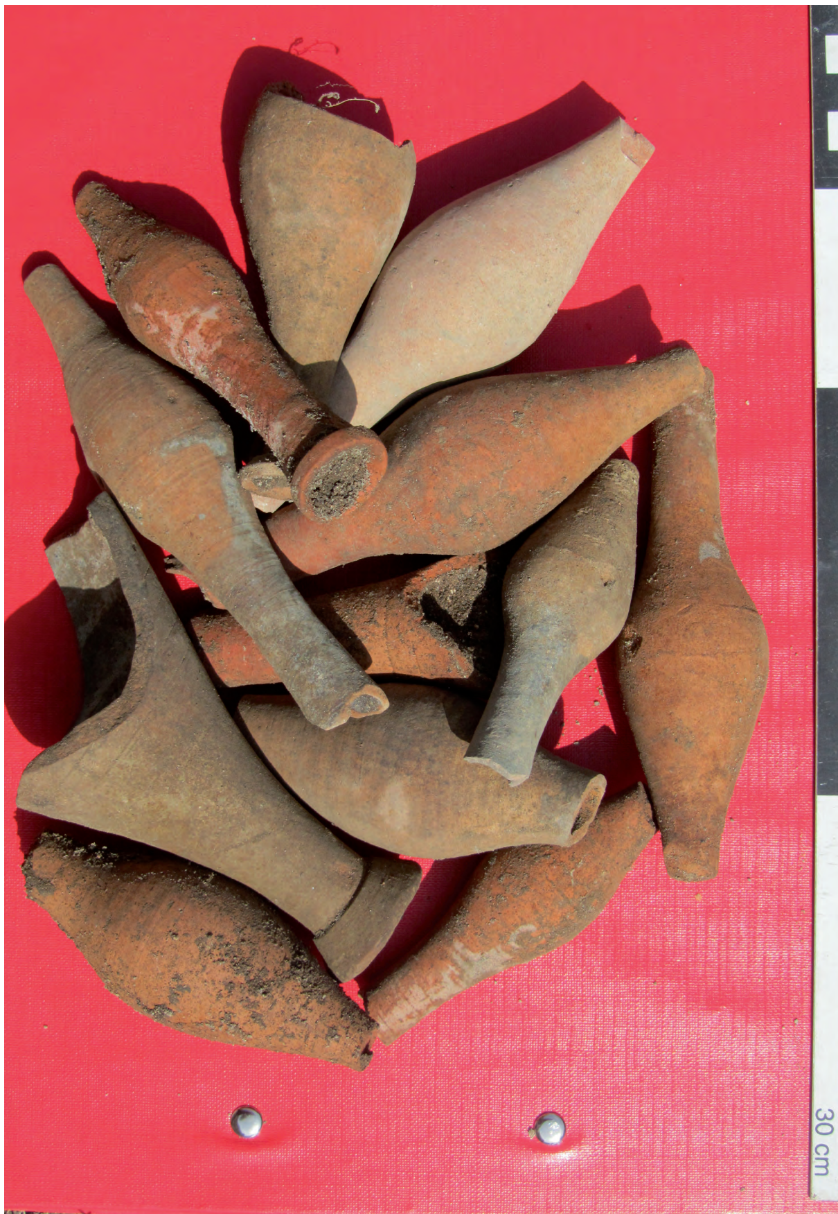
Figura 7: Taberna 28. Ungüentarios fusiformes.