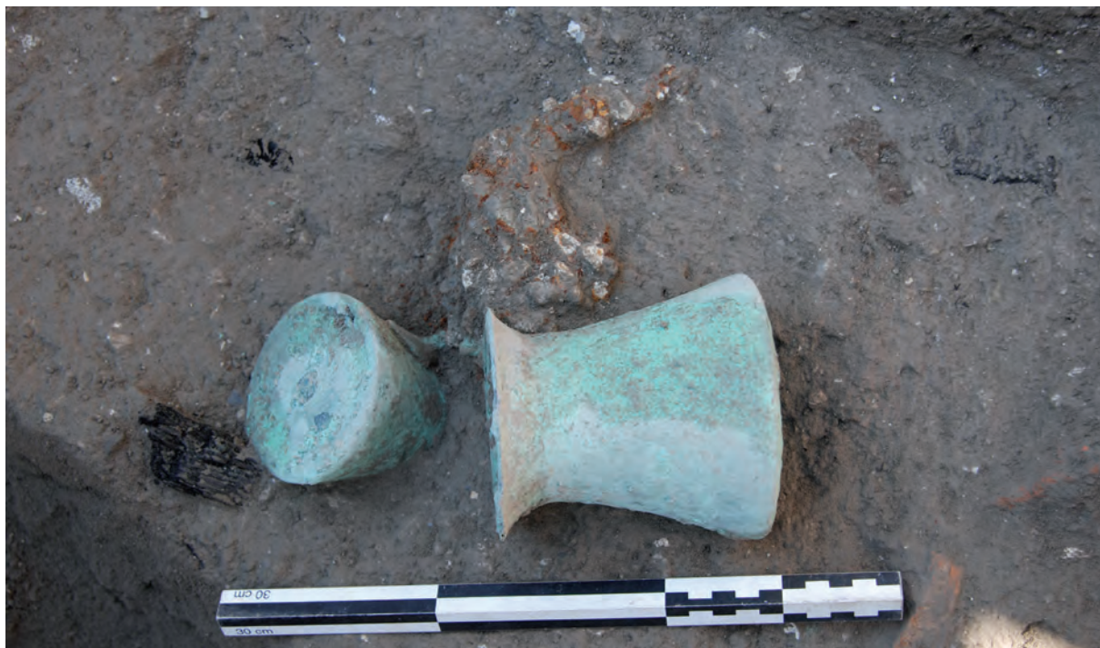
Figura 16: Taberna 26. Medidores de bronce entre el lapilli.