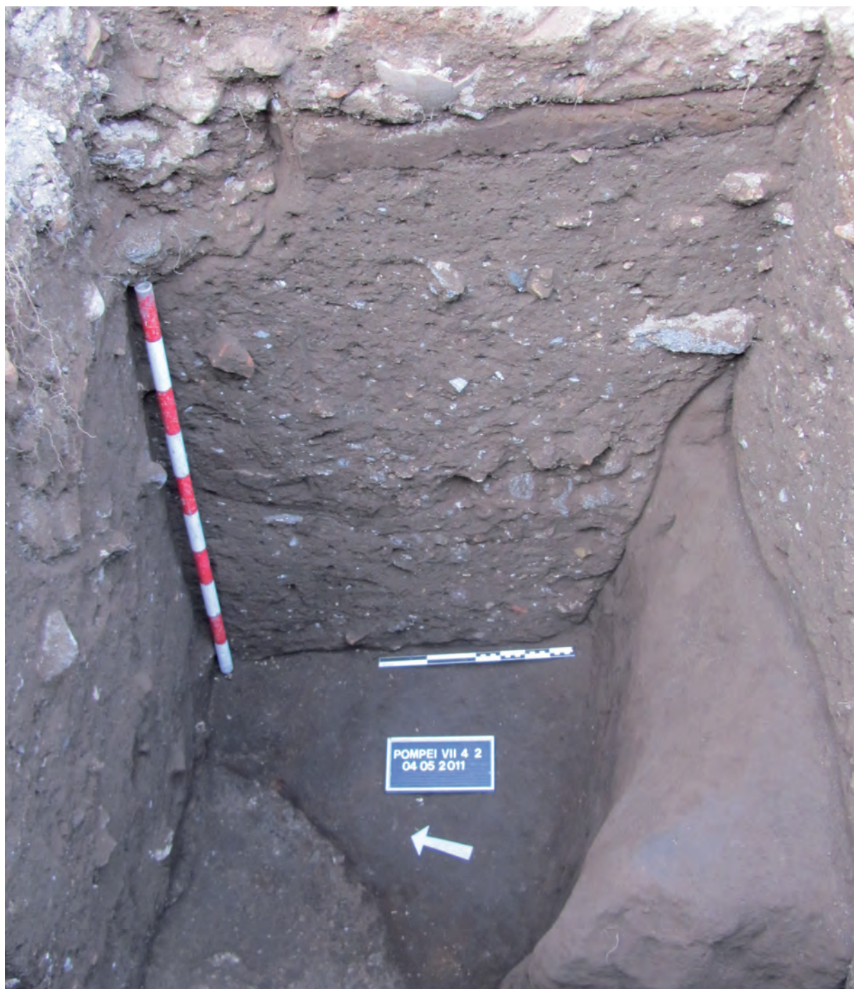
Figura 4: Taberna 28. Perfil este con la fosa y los rellenos samnitas que la cubren.

En esta campaña probablemente se haya vuelto a localizar el referido foso en el centro del sondeo de la taberna 28 (fig. 4), lo que explicaría el extraño perfil que presenta la