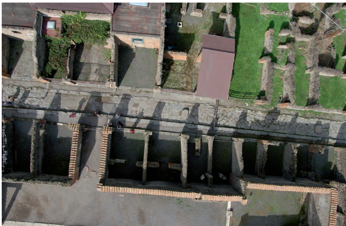
Figura 2: Vista aérea de la vía degli Augustali . Fotografía: CJB.