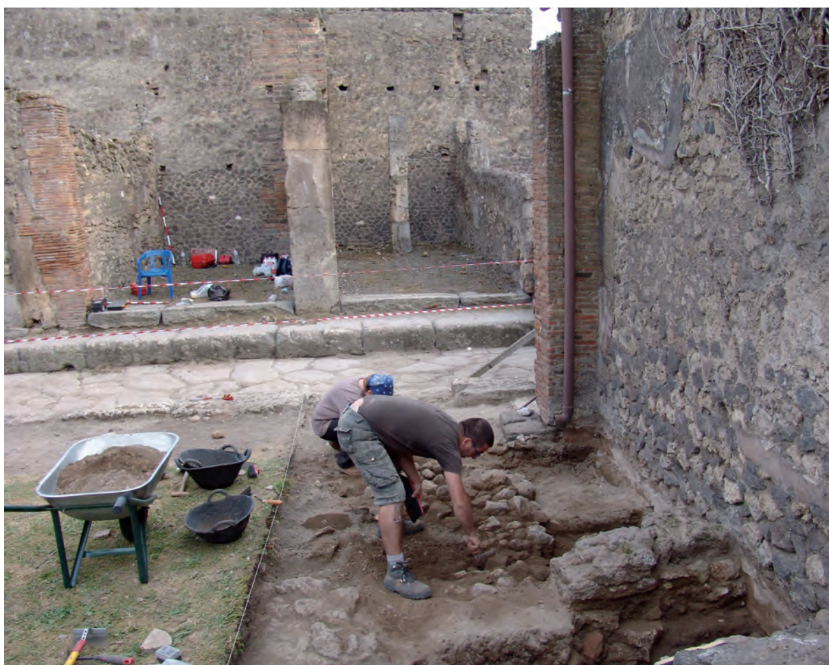
Figura 1: Excavación de la taberna 26, con el macellum al fondo.

El área de los sondeos de 2011 en la vía degli Augustali se encuentra en pleno centro cultural, social, religioso, político y, sobre todo, económico de Pompeya, debido a la cercanía del complejo forense (Dobbins, 1994), especialmente el macellum , ubicado al otro lado de la calle (fig. 1).