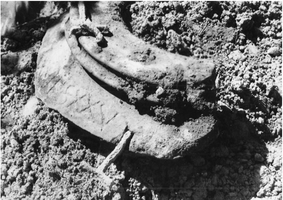
Figura 4. Detall de la vora de dolium amb inscripció (Chinchilla).