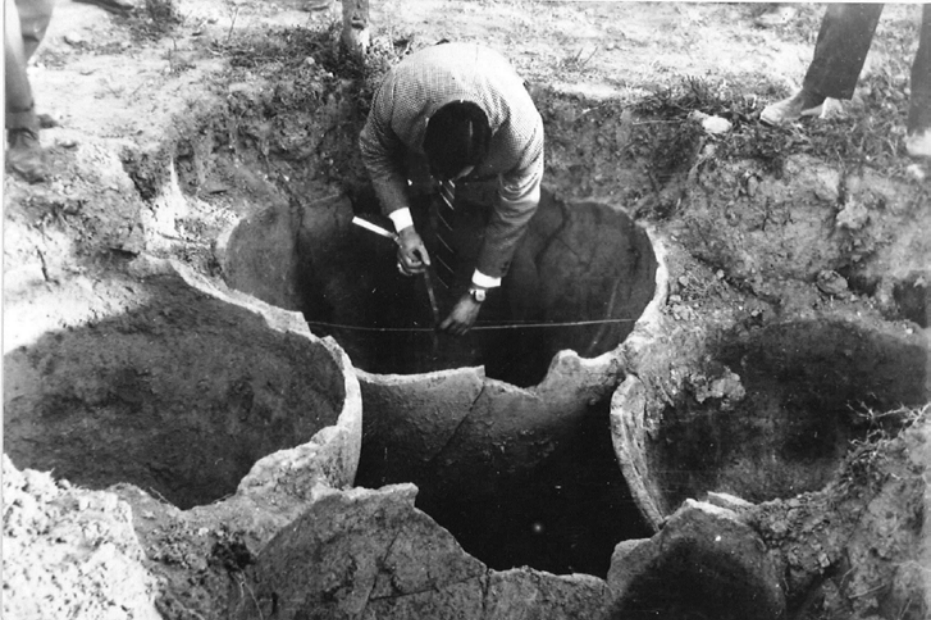
Figura 3. Vista dels quatre dolia excavats (Chinchilla).