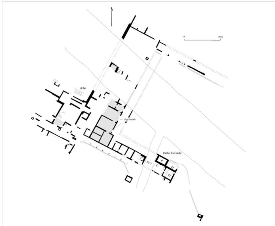
Figura 1. Plànol de la vil·la de Cal·lípols amb la situació dels dolia.