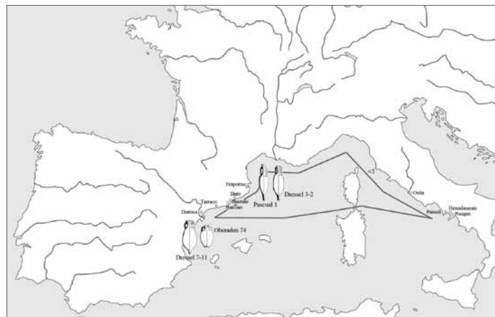
Fig. 1. Rotte marittime fra la Hispania Citerior e la Campania, con indicazione dei principali centri di produzione e consumo e del tipo di anfore.

Tchernia e Zevi 2 pubblicarono un'anfora Dressel 2 di Ercolano con il bollo inciso NP 3 . Le caratteristiche del corpo ceramico rossastro, con grossi frammenti di quarzo come degrassante, sono tipiche delle produzioni laietane, in questo caso della regione vicina alla città romana di Iluro (Mataró). Il bollo NP si trova presso la villa romana di Torre Llauder, vicina a questa città, e anche a Baetulo (Badalona); le anfore con questo bollo hanno un'ampia diffusione commerciale, e sono attestate a Ille Rouse (Corsica), Roma, Ostia e Cartagine 4 (fig. 2).