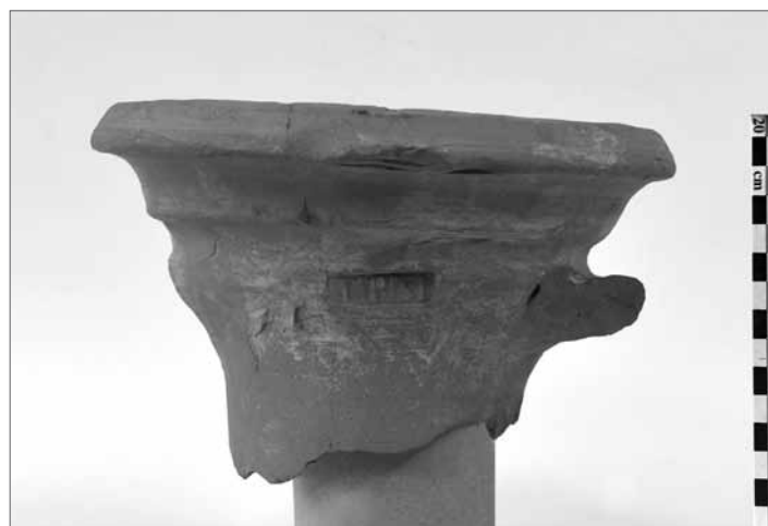
Fig. 4. Frammento di anfora della forma Dressel 7-11 trovata a Pompei, nella zona del tempio di Apollo.

L'altra area geografica ispanica i cui prodotti hanno raggiunto Pompei, anche nell'età di Augusto (come si deduce dall'anfora Oberaden 74 con il bollo di C. Mussidius Nepos ), potrebbe essere il sud dell'odierna Catalogna, nella zona della