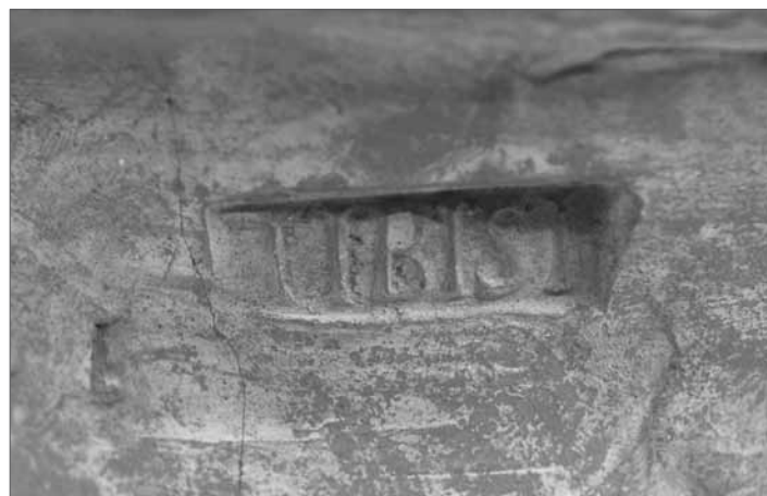
Fig. 5. Dettaglio del bollo dell'anfora della fig. 4, "TIBISI".

foce del fiume Ebro; l'anfora potrebbe essere stata trasportata attraverso il porto marittimo-fluviale di Dertosa (Tortosa). L'ipotesi è confermata dalla presenza di un esemplare della forma Dressel 7-11 con bollo TIBISI, che presenta anche il problema dell'identificazione del contenuto ( salsamenta o altro?).