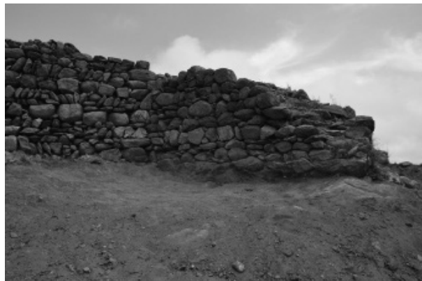
Figura 5. Detall del desenrunament de la torre n.1.

En el sector 3, finalment, s'ha descobert un petit àmbit, adossat a la cara interior de la muralla, d'uns 10 m 2 de superfície, delimitat per uns murs en les cares est, sud i est, mentre que al nord encaixava amb l'aflorament rocós que delimita el sector 1 al sud. Sota el superficial s'ha diferenciat un nivell, que correspon-