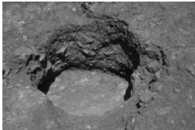
Figura 3. Sitja localitzada en la rasa longitudinal de la zona 2. (Imatge Anna M. Puig).

llargada nord-sud, de 3,90 m, per una amplada est-oest, de 4,70 m, i una alçada conservada d'entre 0,50 m i 1 m. La seva construcció s'ha vist a base de pedres de mida mitjana, sense desbastar, disposades sense morter. Singularment, la torre no estava lligada amb la paret de la muralla sinó que s'hi lliurava, el que portaria a considerar-la una obra posterior, tot i que pot explicar-se, també, com a una estratègia constructiva.