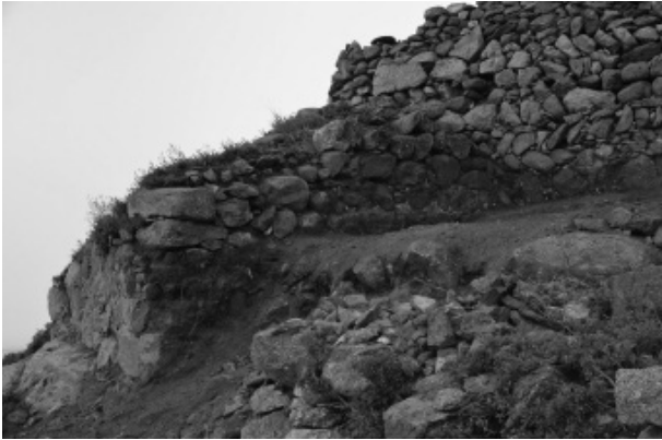
Figura 7. Detall del desenrunament de la torre n.5 costat nord.

ja havien netejat les cares est i sud fins a nivell de fonamentació, mentre que la cara est restava emmascarada per la runa generada per l'enderroc secular de la muralla i per les acumulacions de pedra i terra que degué produir la definició d'un circuit peatonal que entorna el poblat. El desenrunament d'aquesta part no només ha deixat a la vista el parament que faltava sinó també ha permès examinar la fonamentació i l'entrega del mur amb el tram de muralla que es dirigeix cap a l'oest.