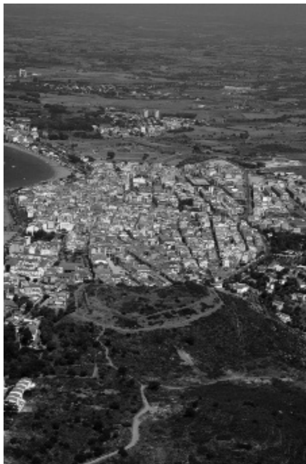
Figura 1. Localització de l'assentament de Puig Rom (Imatge: Santi Font).

El jaciment del Puig Rom es troba situat dins el terme municipal de Roses, damunt d'un turó sobre la població, a la cota de 230 m snm (Fig. 1). Està protegit en tant que Bé Cultural d'Interès Nacional (BCIN) amb les categories de Monument històric, des del 1949, i Zona arqueològica, des del 1964. Tanmateix, també gaudeix de protecció pel fet trobar-se dins els límits del Parc Natural del Cap de Creus (PNCC). Els primers treballs d'exploració remunten a l'any 1917, fets per Josep Maria Folch i Torres, oficial tècnic de la Junta de Museus de Barcelona. A partir d'aquests no es torna a intervenir fins les campanyes portades a terme per Pere de Palol durant els anys 1946-1947, en el marc