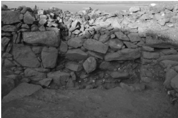
Figura 4. Detall de la porta localitzada durant la campanya de 2017.

a càrrec de l'empresa Signinum Restaura SL .