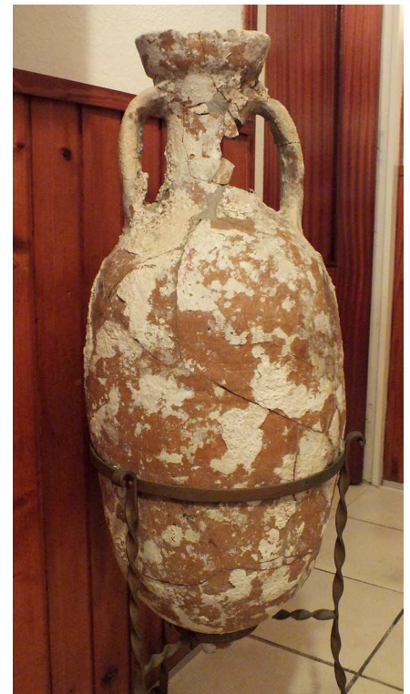
Fig. 1.- Fotografía frontal