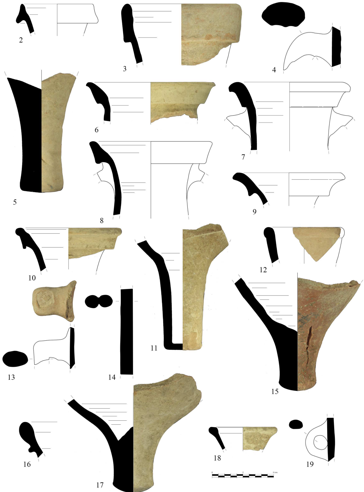
Fig. 3.- Selección de material anfórico de la U.E. 3017: Dr. 1 A vesubiana (2), Dr. 1 itálica no vesubiana (3-5), ovoides gaditanas – Dr. 7/11 (6-11), rodias (12-13), Dr. 2-4 tarraconenses (14-15), Ovoide 1 gaditana (16), ovoide Valle del Guadalquivir (17), tipo urceus (18) y de tradición púnica, posiblemente ebusitana (19)