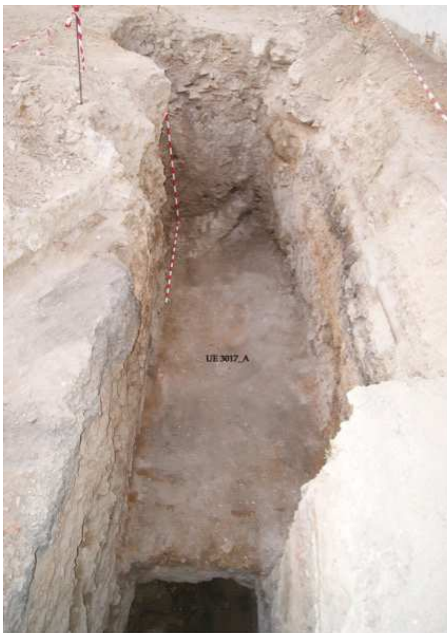
▲ Fig. 2.- Detalle del proceso de excavación de la ampliación del Sondeo 3 (U.E. 3017)

El nivel en el cual se recuperó el fragmento (U.E. 3017) se corresponde con la parte media del Testaccio gaditano, procediendo de la ampliación oriental de la denominada Fase II del Sondeo 3: esta unidad estratigráfica constituye un nivel de relleno caracterizado principalmente por presentar una matriz arenosa, un color castaño claro, una granulometría media y un grado de compactación bajo, de unos 42 cm de potencia, cierta heterogeneidad de su composición así como una elevada presencia de materia-