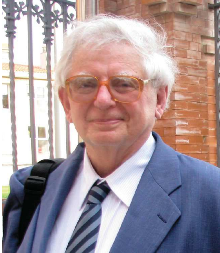
Géza Alföldy en el Rectorado de la Universitat Rovira i Virgili en ocasi3n de la presentaci3n del volumen del CIL dedicado a Tarraco . Tarragona, 3 de mayo de 2011