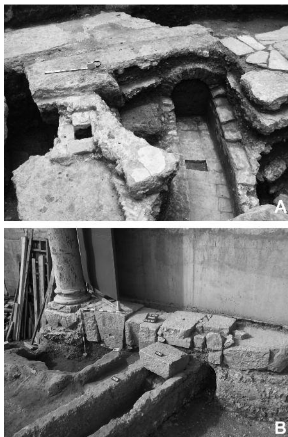
Fig. 2. Nueva construcción de colectores en Corduba (A) (Sánchez, 2011: 140) y Valentia (B) (Ribera, Romani, 2011: 340).

Los momentos de revitalización urbana, especialmente centrados en los siglos IV y VI, este último coincidiendo con el nuevo impulso constructivo episcopal que viven muchas ciudades hispanas, repercutirán a menudo en una recuperación parcial o nueva construcción de cloacas, o simplemente en una cierta preocupación por la continuidad de funcionamiento de la red de saneamiento. La previsión de colocación de embocaduras en las murallas tardías que dieran salida a las aguas residuales urbanas, como se detecta, por ejemplo, en Barcino 11 , así lo demuestra. La construcción de nuevos edificios y la recuperación de otros abandonados también generan nuevas necesidades de gestión residual. En ciertas ocasiones se constata la construcción de nuevos canales y cloacas, comúnmente para gestionar el desagüe de edificios concretos o pequeñas áreas urbanas. Los casos conocidos son numerosos. Se identifican, por ejemplo, en Barcino 12 e Iluro 13 , donde antiguos colectores son vaciados y sus cubiertas son sustituidas por otras nuevas, con abundante material reutilizado. Una situación similar se comprueba en Corduba : en las termas de la c/ Duque de Hornachuelos, en uso hasta el s. V, se identifican dos remodelaciones de sus albañales, empleando nuevas técnicas y materiales (abovedados y de ladrillo) (Fig. 2A) y, a su vez, el mantenimiento del colector central del cardo minor cercano, con el uso de una columna