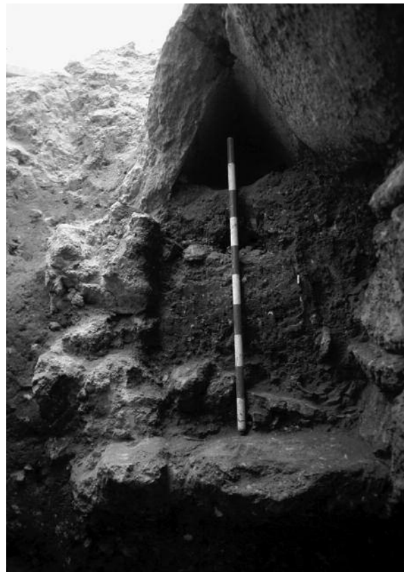
Fig. 1. Colmatación del interior de una cloaca de Carmo (Linerós, Román, 2011: 115).

En contraste, la continuidad y mantenimiento del alcantarillado se da de forma más masiva en los núcleos, o partes de ellos, que se mantienen habitados. En estos casos el hecho de que no se interrumpieran los vertidos de los edificios y viviendas del entorno mantendría activo el flujo de las acometidas secundarias hacia los conductos centrales, impidiendo una acumulación excesiva de sedimentos en su interior. Es especialmente interesante el ejemplo de la Plaza del Rey de Barcino , donde se ha comprobado la construcción continuada de canalizaciones secundarias procedentes de una cetaria , una tinctoria y una fullonica , que vertían al colector del cardo de la zona, en uso ininterrumpido al menos hasta el siglo V 6 .