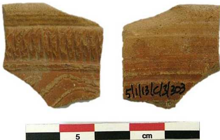
Figura 1: Fragmento de forma Drag. 29 en TSH Brillante

En segundo lugar, queremos destacar su relevancia en cuanto que constituye el único caso publicado hasta la fecha en el que se constata la imitación de motivos decorativos de influencia gálica en TSH Brillante. No podemos asegurar si se trata de un influjo directo de la TSG o el referente se encuentra en las producciones más antiguas de TSH que imitan las decoraciones de la sigillata sudgálica, ya que esta cuestión está directamente relacionada con la datación del contexto de aparición de nuestro fragmento, pendiente de precisar. En este sentido, para nuestro caso, podemos encontrar paralelos formales y decorativos evidentes, por ejemplo en dos piezas documentadas en Numantia, una proce-