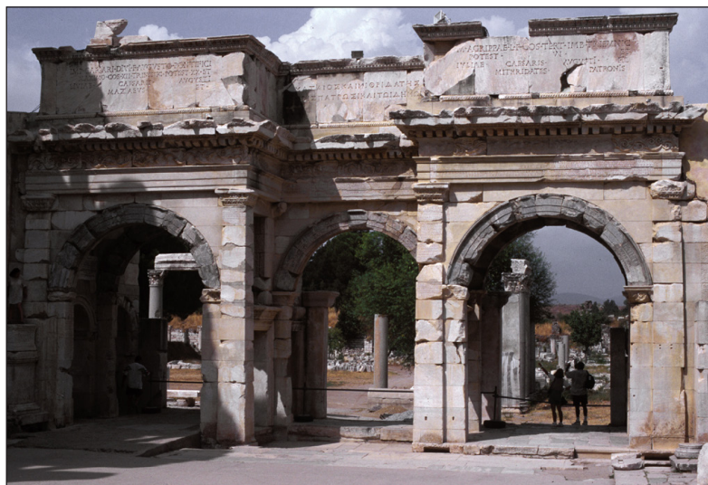
Figura 5. Efeso. Porta dell'agorà tetragona dedicata da Mazeo e Mitridate.

Soluzioni analoghe troviamo a Spoleto, in Umbria, nell'arco a fianco del tempio maggiore del Foro, dedicato dal Senato cittadino nel 23 circa dC. agli stessi Germanico e Druso Minore, cui forse faceva da pendant un altro monumento analogo sul lato opposto del tempio 23 . Stessa soluzione negli assai poco conservati archi del Foro di Cupra Marittima, nel Piceno, che dobbiamo ricondurre allo stesso clima, caratterizzato da preoccupazioni dinastiche che coinvolgono il lealismo delle comunità civiche di diverse città d'Italia 24 . E una situazione analoga troviamo ancora a Pompei nell'età tiberiano-claudia, con gli archi eretti ai lati del Capitolium del foro 25 . Del resto sappiamo bene che questi "ricalchi" si riscontrano anche nel mondo provinciale: basti pensare al Foro di Mérida o a quello cosiddetto "provinciale" di Tarragona, entrambi in rapporto proprio con il Foro di Augusto a Roma, per averne una sicura conferma.