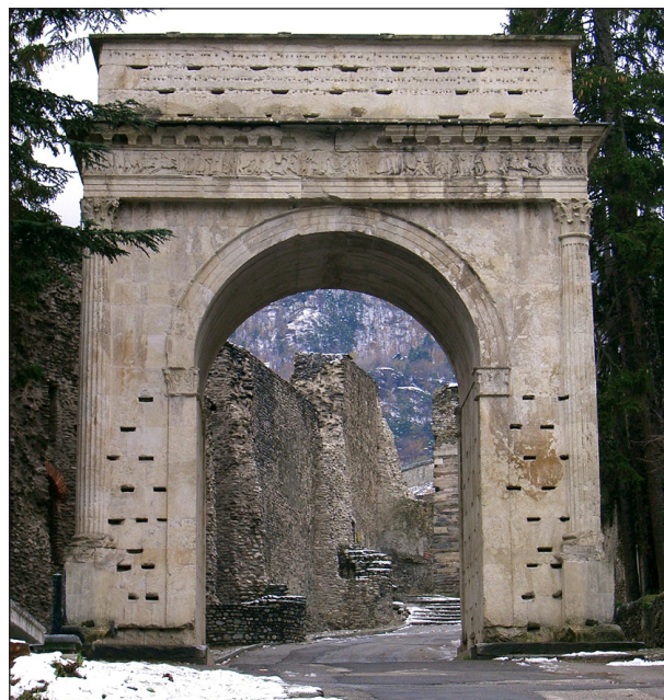
Figura 4. Susa (Alpi occidentali). Arco augusteo.

di, con una soluzione raramente ripresa (ad Orange, ad esempio, in età tiberiana) 17 . L'alto basamento, quasi un podio templare sotto le basi delle colonne, realizzato dall'architetto del monumento di Augusta Praetoria sarà ripreso in quello di Barà, in Tarraconese (fig. 3), che le acute ricerche del compianto Xavier Dupré hanno ricondotto alla sua giusta cronologia augustea 18 . Come per gli elementi verticali dell'ordine applicato, così anche per quelli orizzontali si stabiliscono norme che resteranno connesse alle facciate degli archi per lungo tempo: la trabeazione è continua, come nel classicheggiante, piccolo arco di Susa (fig. 4) nelle Alpi occidentali 19 , oppure si articola con risalti e rientranze, in corrispondenza delle colonne e degli intercolunni. Si definisce così un lessico monumentale, una sorta di retorica delle parti applicate che pone adeguatamente in risalto le valenze celebrative e i contenuti politici affidati a questi monumenti augustei sia attraverso la parola scritta delle grandi epigrafi poste sugli attici, sia coi corredi figurativi, applicati ai piloni o sovrapposti agli attici stessi nei gruppi scultorei di bronzo dora-