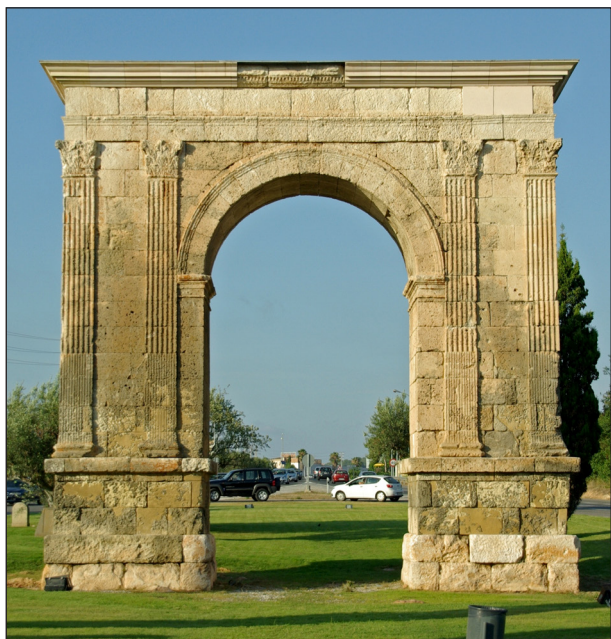
Figura 3. Roda de Barà ( Hispania citerior ). Arco augusteo dedicato da L. Licinio Sura.