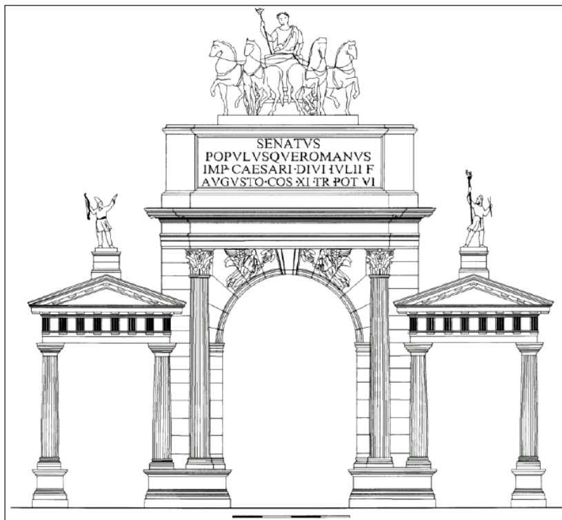
Figura 2. Roma Foro Romano. Arco di Augusto a sud del tempio del Divo Giulio (ricostruzione Gamberini Mongenet).

L'aver scelto l'arco celebrativo come importante veicolo, a Roma, in Italia e nelle province, dei contenuti dell'ideologia e della politica del Princeps , replicandone le realizzazioni in un numero sempre crescente di esemplari, ne segnerà per secoli la storia e le caratteristiche, che prenderanno le mosse da questi iniziali programmi augustei. Ma anche dal punto di vista formale gli architetti di Augusto, a Roma e ben presto dovunque, creano un prototipo a lungo rimasto punto di riferimento architettonico, soprattutto per quanto attiene alla definizione spaziale delle facciate e al tema dell'applicazione di un ordine, che resta quasi esclusivamente quello co-