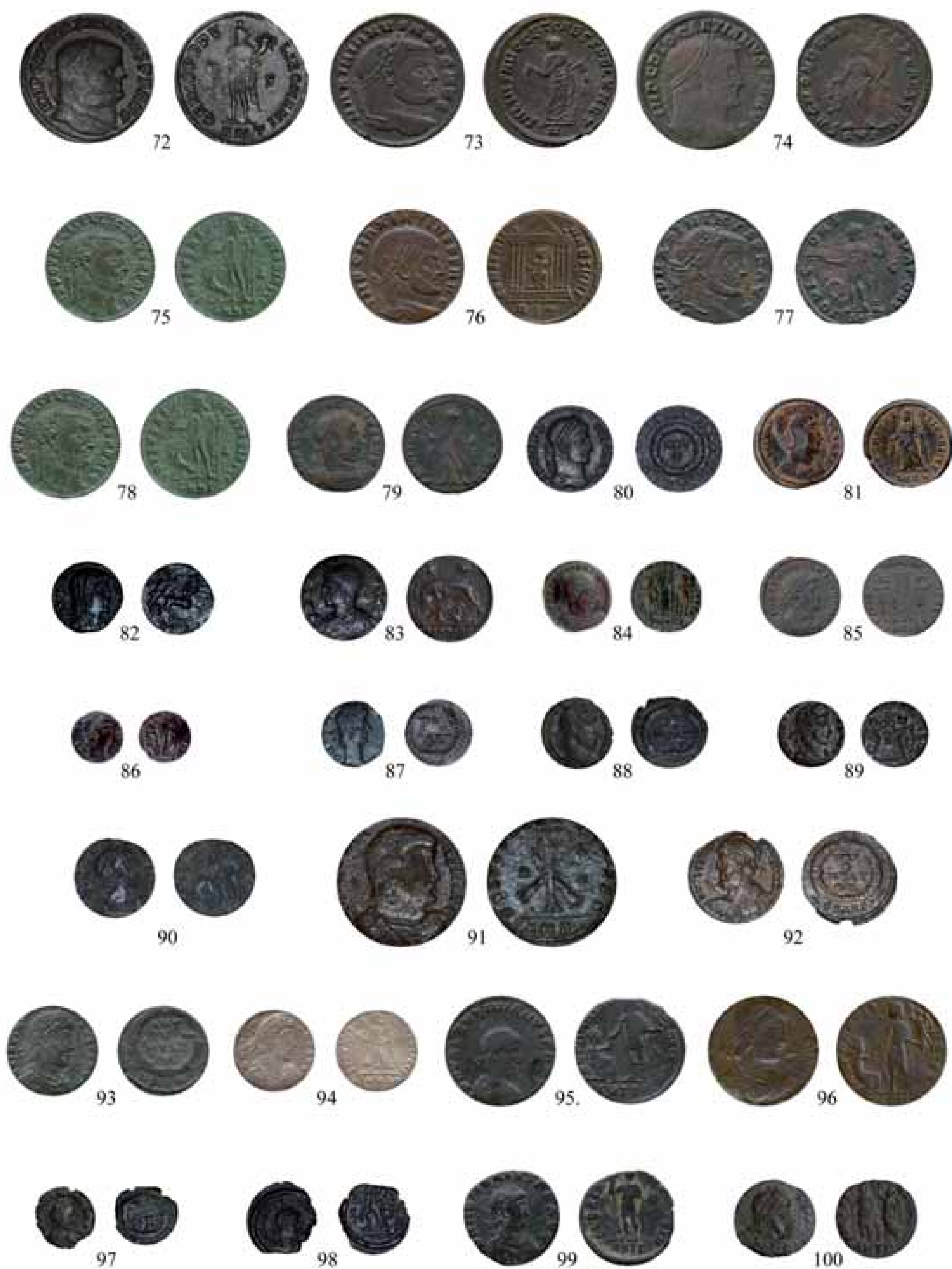
Figura 4.- Núms. 72 a 100. [Imagen sin escala].