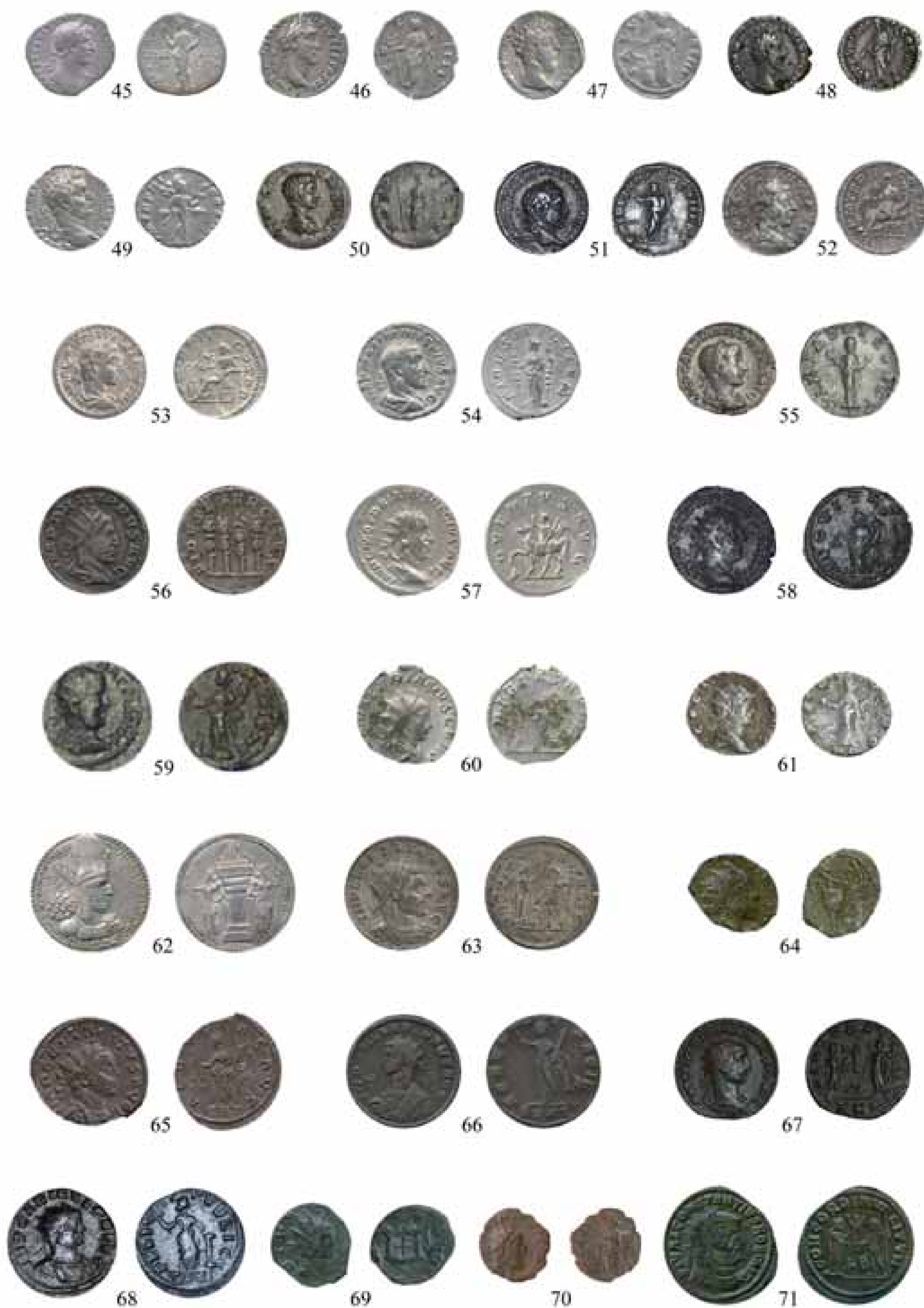
Figura 3.- Núms. 45 a 71. [Imagen sin escala].