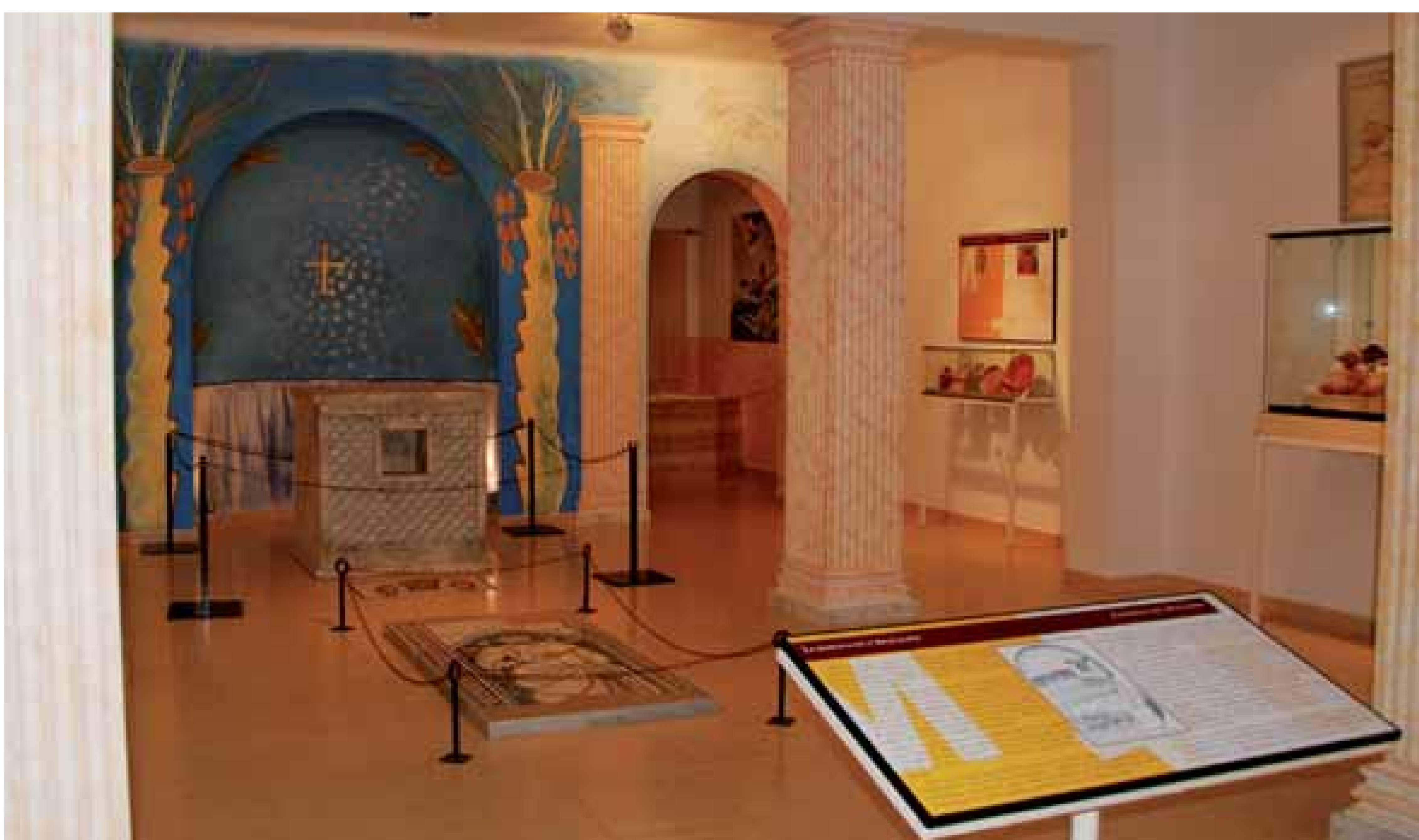
Figura 7.- Sala del Museo dedicada al cristianismo.