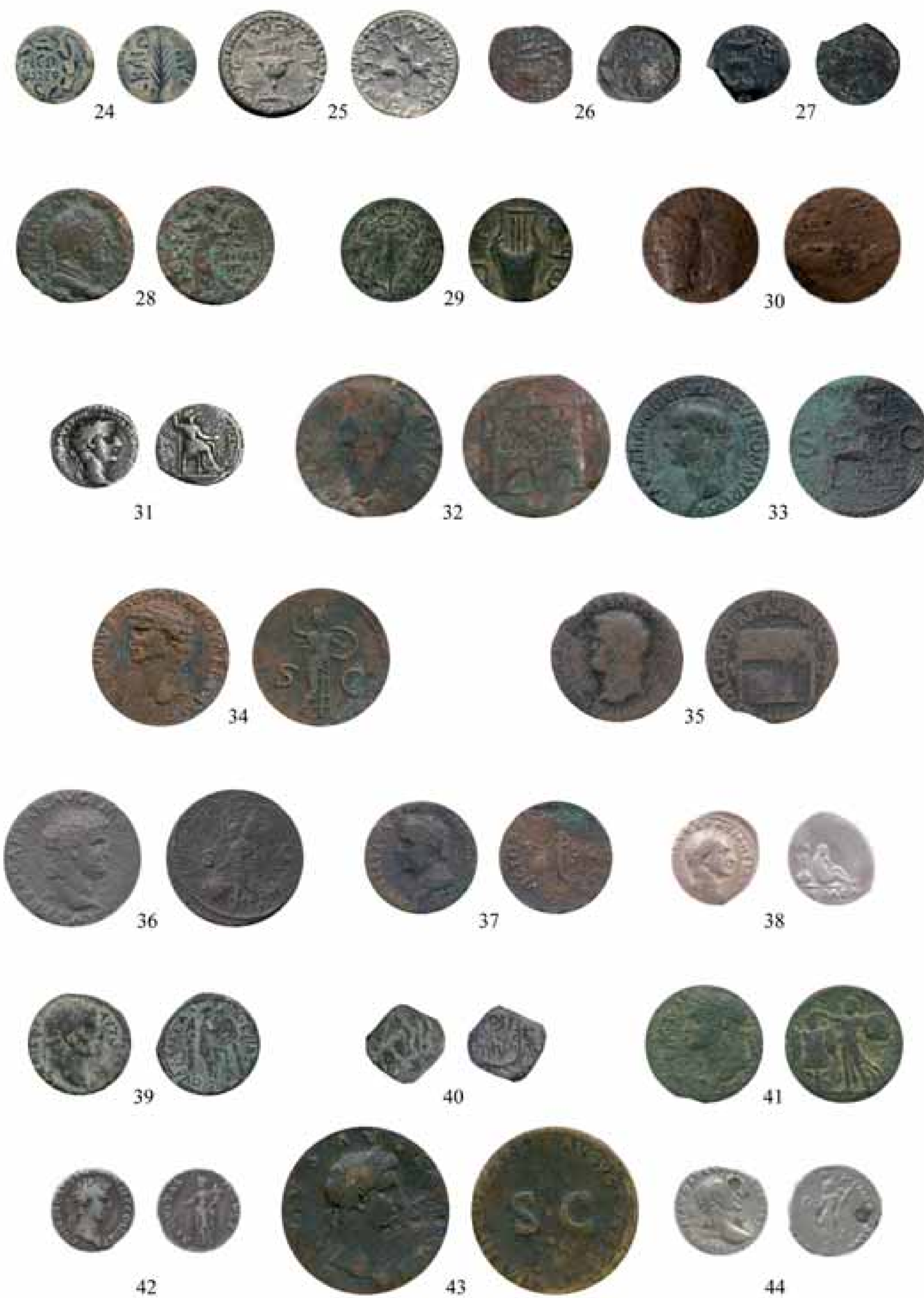
Figura 2.- Núms. 24 a 44. [Imagen sin escala].