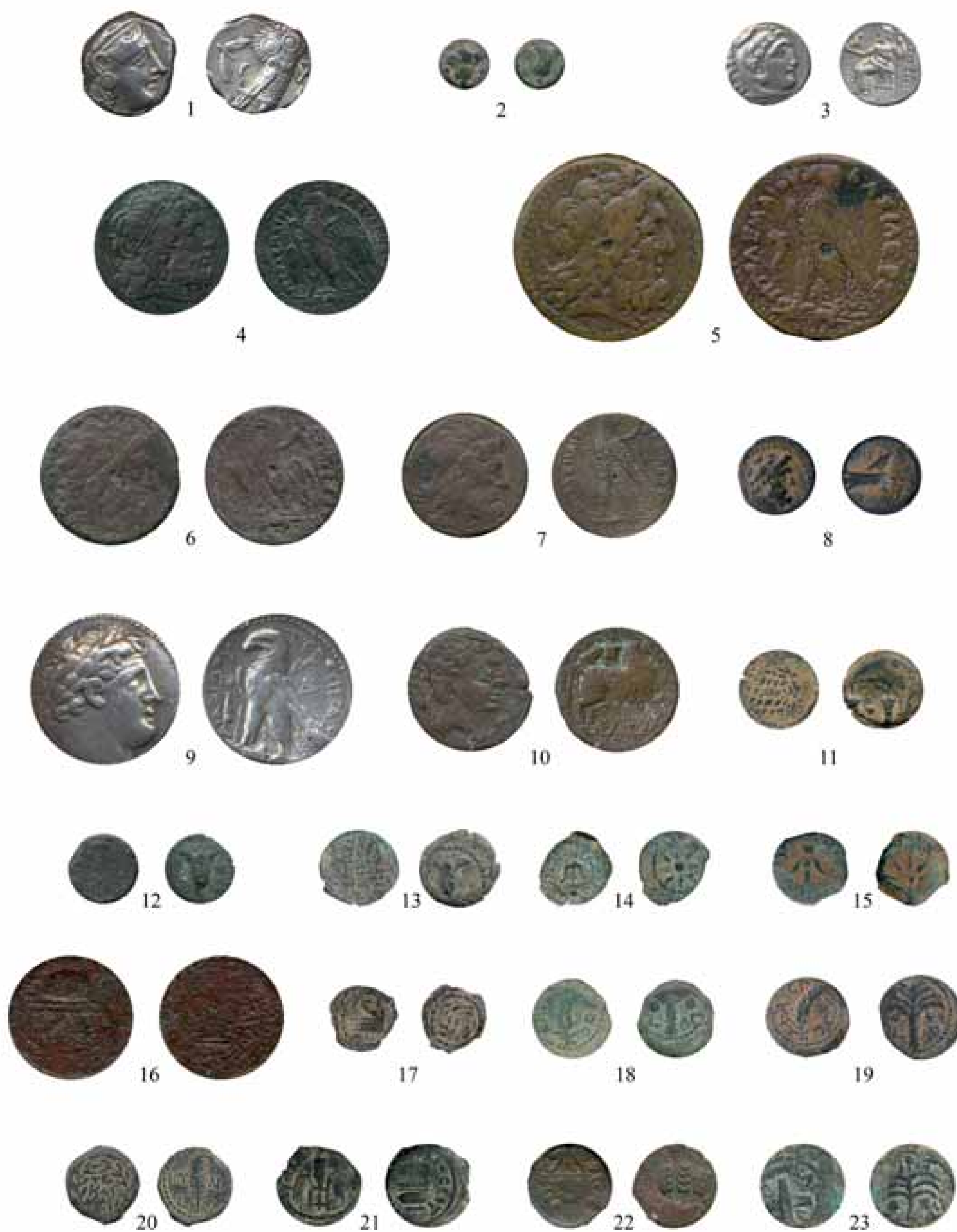
Figura 1.- Núms. 1 a 23. [Imagen sin escala].