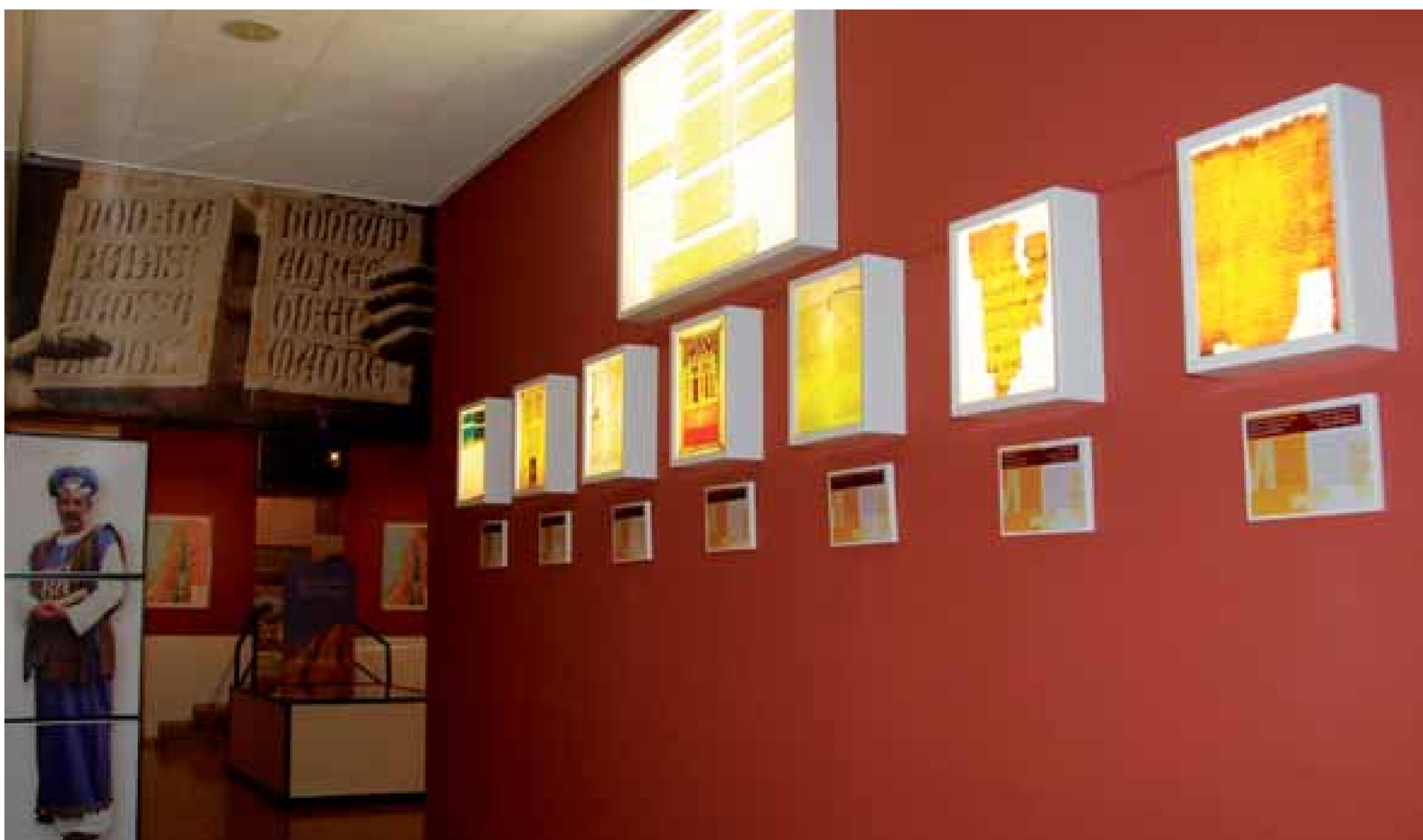
Figura 6.- Vestíbulo de entrada del Museo Bíblico Tarraconense.