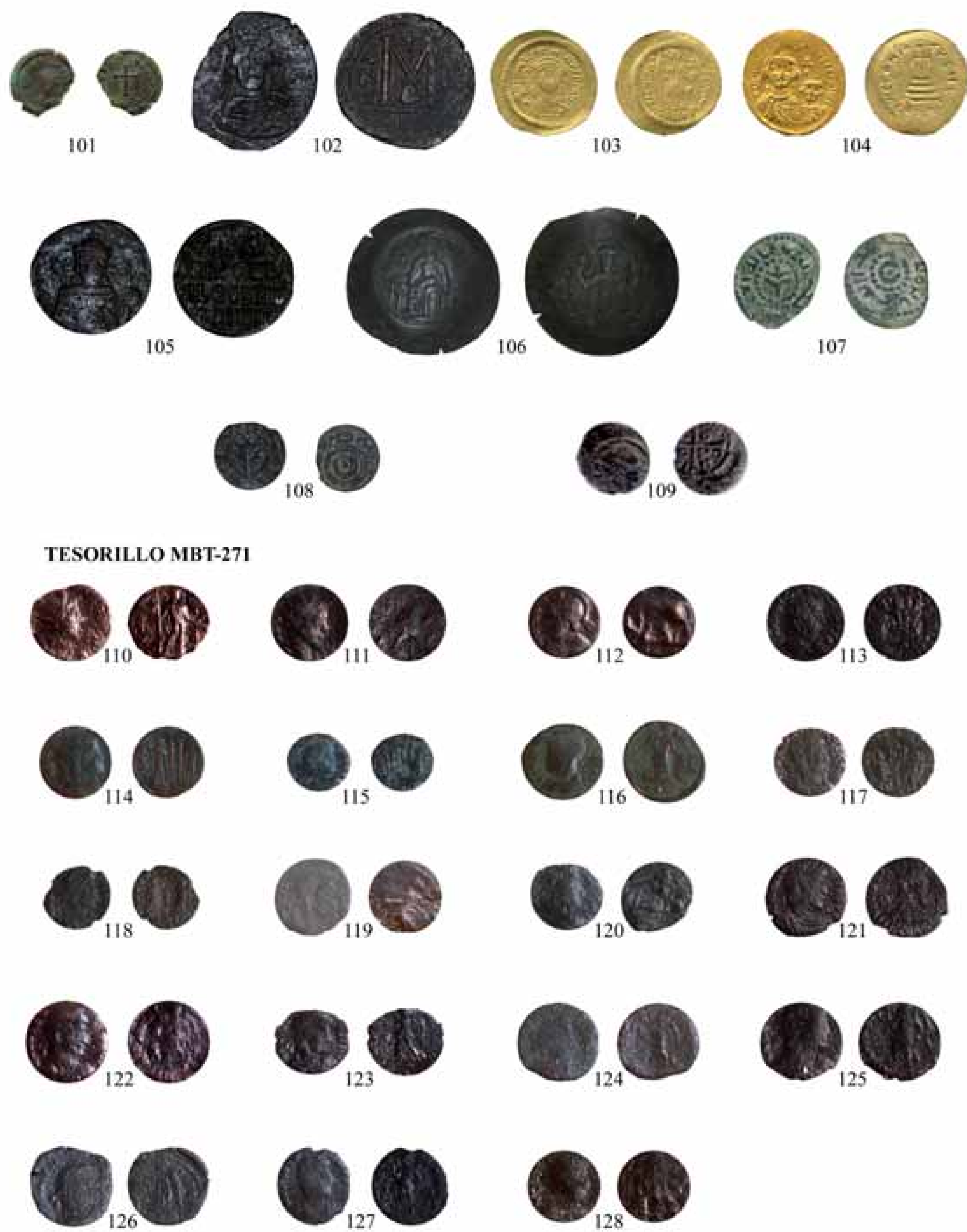
Figura 5.- Núms. 101 a 128. [Imagen sin escala].