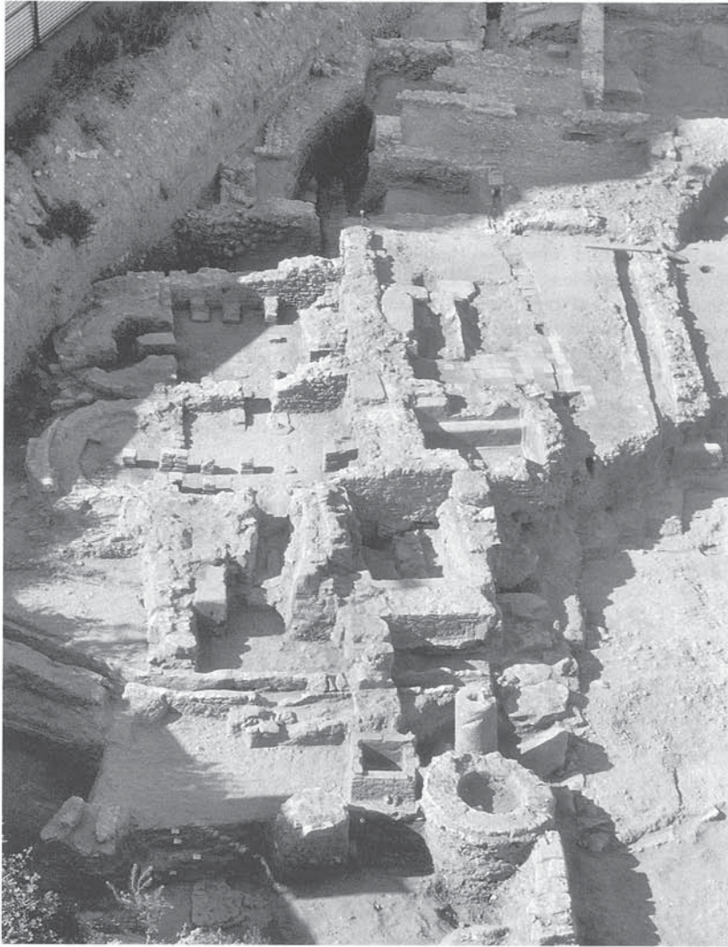
Fig. 53. Termes privades de la domus portuària de l'època tardana (ADSERIAS et al. 2000a).

tat en l'entitat constructiva de la nova arquitectura domèstica originats per un empobriment progressiu i desequilibrat de la societat tarragonina. D'aquesta manera trobem —sobretot a la zona alta de la ciutat— estructures residencials construïdes a base de murs de pedra irregular i argila, pavimentacions de terra i pous cecs o abocadors que cronològicament conviuen amb altres edificacions aixecades amb carreus reciclats o murs de maçoneria amb morters i paviments d' opus signinum . Aquests