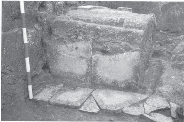
Fig. 51. Larari de la domus portuària del segle II (ADSERIAS et al. 2000a).

A partir del segle IV documentem l'abandonament de la infraestructura de sanejament i del Fòrum de la Colònia i la construcció de nous barris residencials a la zona portuària amb criteris urbans diferents (ADSERIAS et al. 2000a). No és un canvi estrictament de caire arquitectònic o urbanístic: per primera vegada trobem coexistència, que també es posa de manifest als assentaments rurals (MACIAS et al. 1999), entre la zona d'hàbitat urbà i la de deposició funerària. Tot i que es va mantenir la prohibició d'enterrar dins el recinte murallat, a excepció —a partir del segle VI— de casos associats a centres de culte cristians, observem un fenomen de convivència física entre