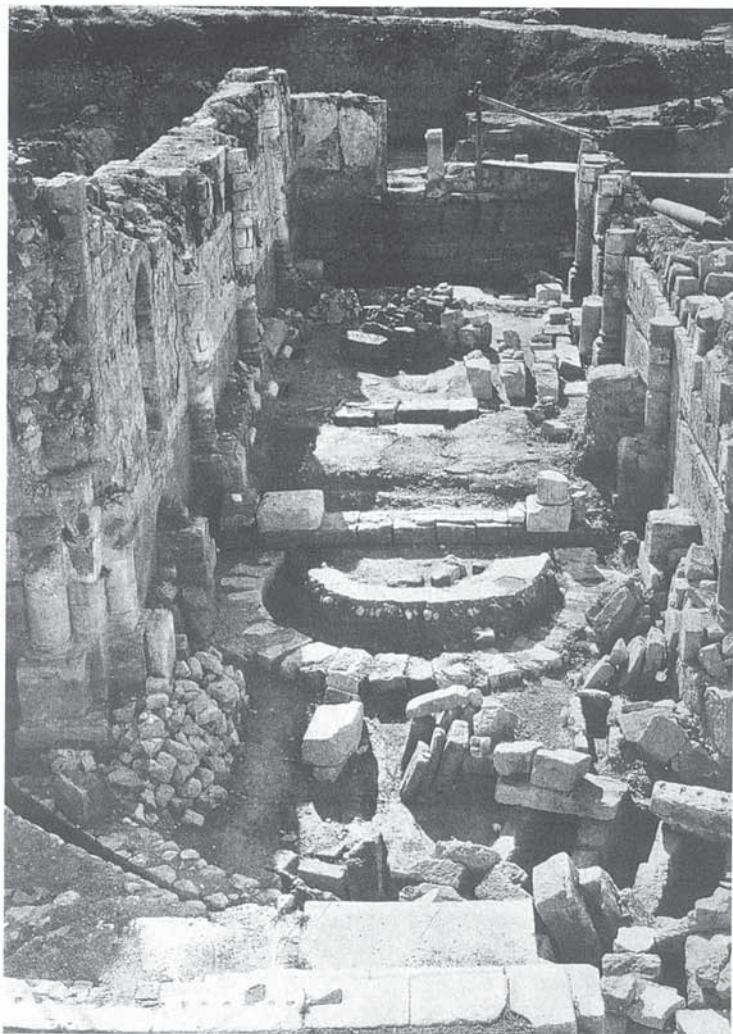
Fig. 47. Restes de la basílica visigoda (segle VI) en el moment de trobar-la (1953).