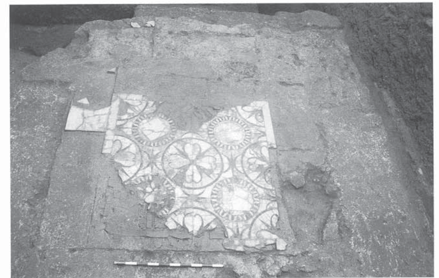
Fig. 50. Detall de motiu en opus sectile.