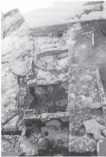
Fig. 48. Vista superior de les tabernae meridionals del recinte forense.

A diferència de la zona intramurs, la nova organització viària no disposava d'una parcel·lació ortogonal rígida, i els escassos exemples coneguts demostren una ocupació domèstica articulada mitjançant àmplies domus , que reflecteixen un ús del sòl urbà menys restringit.