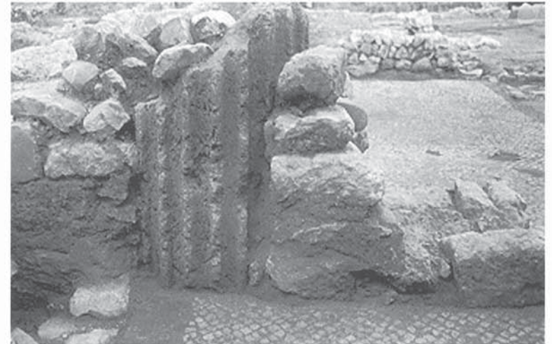
Fig. 52. Mur de compartimentació domèstica de les termes públiques (Foto: Arxiu Codex).

Tots aquests canvis reflecteixen la privatització d'alguns serveis públics antics —termes, subministrament d'aigua potable i eliminació de residus— i, especialment, una vitalitat urbana menor. En conseqüència, un retrocés tecnològic i una desigual-